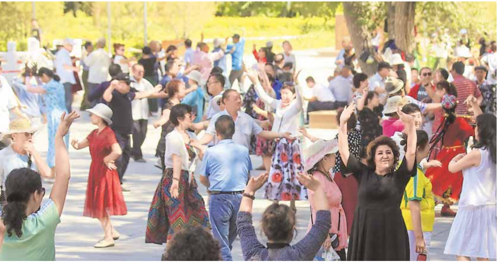
جايدارى جازىدەك شاتسەنا شۇمىلى 7 - ئاينىڭ 5 - كۈنى ۱۹ - ئۇلت قالا نۇرۇندارى ئۇزۇبچى قالاسى خالىق باقتاسىدا يىگە باسپ، سامالداپ، جايدارى جازىدەك شاتسەنا شۇمىلى. □ سۇرەتنى تەل. شىمىز شىلە لۇك تۇسىر. گەن

شىنجاڭ گازىتىنىڭ 7 - ئاينىڭ 5 - كۈنى بەيجىڭدىن بەرگەن خەبەرلىرى (ئىشلىتىش باي جىيە). مەملەكەت ئورگانلىرى شىنجاڭ گازىتىنىڭ 7 - ئاينىڭ 5 - كۈنى دىئاگنوزىنى تاي مەملەكەت قوناق ۋەندىگە بانگلادەشىنىڭ زۇڭلىسى ھاسىنامەن كەزەدەستى. شىنجاڭ گازىتى بىلاي دەپ ئاتاپ كورمەستى: جۇڭگو مەن بانگلادەش ۋەندەستى. 2016 - جىلى ھەلە - رىڭىزدە مەملەكەت سىستېرى ساپارنىدا بولغاندا، ھەكى ھەلدىك قارىم - قاتنىشىنى سىترا - تەڭپەزلىك سەلبەستىك سەرىكتەستىك قارىم - قاتنىشىنى كۈتەرپ، ھەكى جاقىنى اۋسى - كۈيىستىك، سەلبەستىك تەز قارقىنىدە مەن داھۇدىك جاڭ ساتسىنا ۋەتۈن لىگەرلەتەتپ، ۋەز ھەلەر ۋەندەستىك ھەكى - نوئىكالىق، قوعامدىق دامۇنىغا جاڭقا قوزغاۋىشى كۈشى سىلالىق، ھەكى ھەل - ھالقىنىدا اناغۇرلىم كۈپ باقتى كەل - دىك. قازىر جۇڭگو - بانگلادەش ھەكى ۋە ۋەز داھۇنىنىڭ شەشۋىشى كەزەڭىدە تۇر. سىتراتېگىيالىق سەلبەستىك سەرىكتەستىك قارىم - قاتنىشىنى ۋەدا - ۋەدا سەلبەستىك، قوغامدىق ھەكىمەدەش، (جالعاسى 2 - بەتتە)