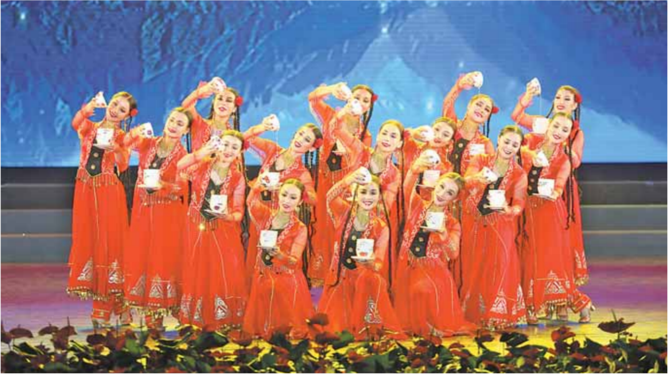
8 - ئايدا 11 - كۈنى ۋۇتۇنومىيالى رايونىنىڭ 2019 - جىلى قۇربان ايت مەرەكەسىنى ئارقىلىق ۋىل مەركەزىدە تەبرىكلەندى. ساۋنىق كەشى شىنجاڭ خالىق تەتارخانىسىدا وىكىزىلدى.

رايونىمىزداعى ۋار ۇلت كادىلارى مەن بۇقارا قۇربان ايت مەرەكەسىن بىرگە توپلادى