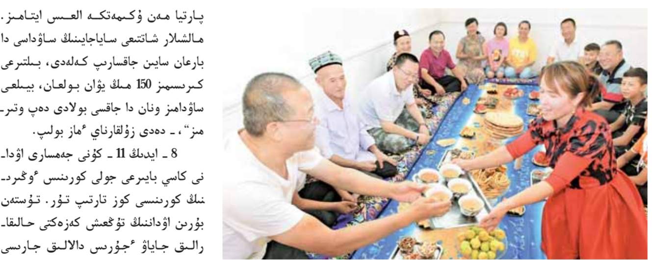
8 - ئايدا 11 - كۈنى قىستاق تۇرغىنى ۋۇتۇنومىيالى رايونىدىكى بازار باقلاز - باسقارۇ مەكەمەسىنىڭ ئوش قالامى ازاق ۋىلى قۇلانى قىستانىدا تۇراتىن “ۋىمۇ، تېمىدىك جاساۋ، توغىستۇ” قىزەت تىرىشلىگى مۇشەلىرى مەن جۇپ قۇرغان تۇستارىن ۋىنە بارىپ مەرەكەنى بىرگە وىكىزۇڭگە ۋىسىنى مەتتى. □ سۇرەتتى ئىلىشىمىز وىكىزۇ نىجات تۇسىرگەن

مالىشلار شاتىتى ساياجايىن اشىتى. “قازىرگى ۋىمىزدە سۇ، توك بار، اس ۋى، دارەتجاناسى بار، سۇ شۇمەكتى اشىپ قالساڭ سۇ كەلەدى، وسىندى جاقسى ۋىدە تۇرىپ جاتقانمىز ۋۇشنى كوشىپ جۇرەتىن، سۇدىڭ تۇنەن، ۋشوپ - تىڭ سونىسنىن قۇالاي قوناننى تۇرمىستى ايقاقسىتىرىپ، تولىۇياقىزىل قىستانىغا كەلىپ وتىرىقتاندى. 2016 - جىلدىن باستاپ، ول كوكشۇلى كورنىسنى ۋىگىرىندە