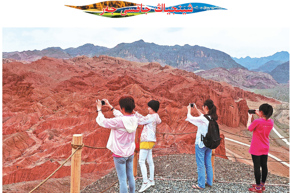
تۇرپان حوبۇنكوۋ ساياسى ساياحاتشىلاردى قابىلداي باسنادى بىشىندەرى كوپتەگەن ساياحاتشىلاردى وسىدا ساياحاتتاۋغا باۋرادى. □ سۆرەتتى لىۋ جيان تۇسىرگەن

2006 - جىلى، «ماناس» 1 - توپتاعى مەملەكەت دارەجەلى بەيزاتتىق مادەد- يەت مۇرالارنىڭ ۋاكىلىدىك تۇنىدارل تىزىمىدە ەندى. 2009 - جىلى بىرلەسكەن مەملەكەتتەر ۇيمى قۇ - ارغا، ئىلىم، مادەنىيەت ۋىمىنىڭ «ادامزاتتىق بەيزاتتىق مادەنىيەت مۇرالارنىڭ ۋاكىلىدىك تۇنىدىلارنىڭ ئىزىمى» نە تاڭدالدى . اۋىزدان - اۋىزغا تارالغان «ماناس»نىڭ اناغۇرلىم وىداعىداي قورغالۇننا جانە جالغاستىرۇلۇننا شىنباي كەپىلدىك ەتۇ ۋشىن، 2009 - جىلى قىزىلسۇ وىلىسى بەيزاتتىق مادەنىيەت مۇرالارن قورغاۋ (ماناسنى قورغاۋ، زەرتتەۋ) ورتالىقىن قۇرۇپ، لىگەرى - كەينىدى 10 مىللىيون يۇاننان استام قارجى قوسىپ، «ماناس»- تى قورغاۋغا جانە جالغاستىرۇغا جۇمسادى . (جالعاسى 4 - بەتتە)