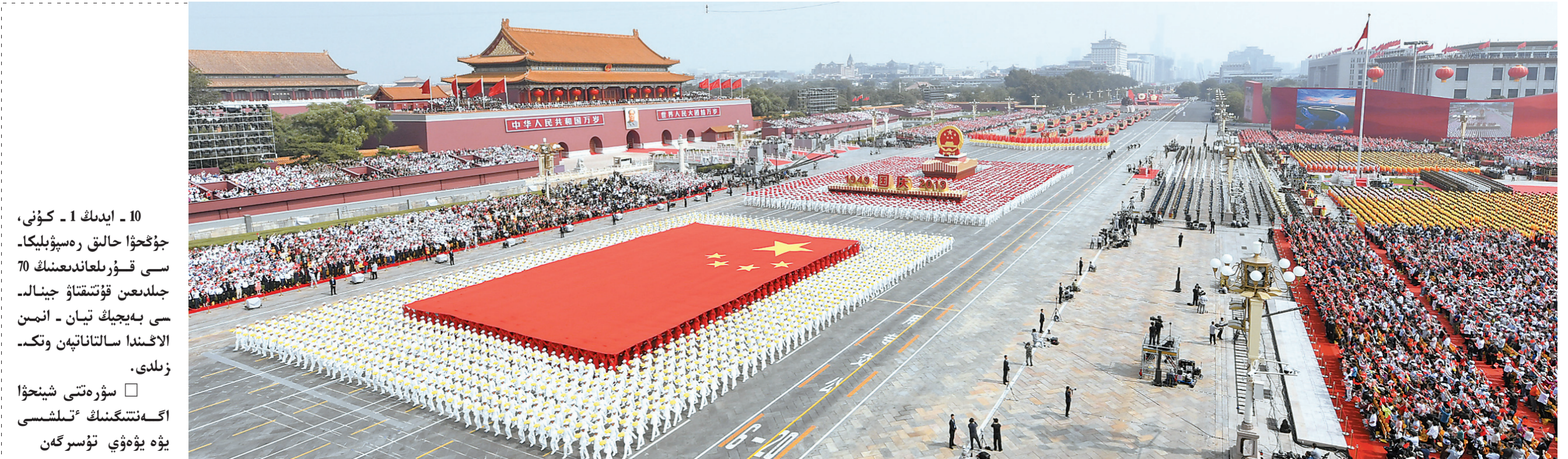
10-ايدىڭ 1-كۈنى، جۇڭخۇا خەلق رەسپۇبلىكىسى قۇرۇلغاندىن 70 جىلدىن قۇتتىقتاۋ جىنالىسى بەيجىڭ تىيان - انىن الاڭىدا سالتاناپەن وتكىزىلدى. □ سۈرەتتى شىنجاڭ اگېنتىگىنىڭ تىلشىي يۈە يۈەۋى تۇسرىگەن

شىنجاڭ اگېنتىگىنىڭ 10-ايدىڭ 1-كۈنى بەيجىڭدە بەرگەن خابارى. ايبىنى اسقاقتا 70 جىل، ۇدەرە العا تارتقان جاڭا ۇداۋىر. 10- ايدىڭ 1-كۈنى تۇستەن بۇرۇن، جۇڭخۇا خەلق رەسپۇبلىكىسى قۇ- رىلغاندىن 70 جىلدىن قۇتتىقتاۋ جىنالىسى بەيجىڭ تىيان - انىن الاڭىدا سالتاناپەن وتكىزىلىپ، 200 مىڭنان استام اسكەرىلەر مەن بۇقارا سالتاناتى اسكەرىي پارادەنى جانە بۇقارالىق شەرۋەمەن رەسپۇبلىكانىڭ 70 جىلدىق مەرەپىيىنى قۇانىشىپ قۇتتىقتادى. جۇڭگو كوممۇنىستىك پارتىيىسى ورتالىق كومىتېتىنىڭ باش شۇجىسى، مەملەكتە ۇوراغاسى، ورتالىق اسكەرىي سىرت كومىتېتىنىڭ ۇوراغاسى شي جىنپىڭ ماڭزىدى ۇسوز سويلەدى جانە پارادەنى تەتتىن اسكەرىي بولىمدەردى كوزدەن كەشىردى. (سوزدىڭ تولىعى 4-بەتتە)