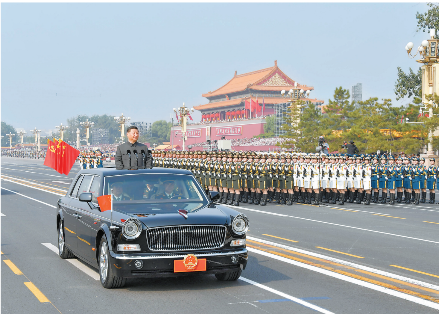
10-ايدىڭ 1-كۈنى، جۇڭخۇا خەلق رەسپۇبلىكىسى قۇرۇلغاندىن 70 جىلدىن قۇتتىقتاۋ جىنالىسى بەيجىڭ تىيان - انىن الاڭىدا سالتاناپەن وتكىزىلدى. سۈرەتتە: جۇڭگو كوممۇنىستىك پارتىيىسى ورتالىق كومىتېتىنىڭ باش شۇجىسى، مەملەكەت توراعاسى، ورتالىق اسكەرىي سىرت كومىتېتىنىڭ توراعاسى شي جىنپىڭ پارادەنى تەتتىن اسكەرىي بولىمدەردى كوزدەن كەشىردى.

لى كىچياڭ باسقاردى، لى جانشۇ، ۋاڭ ياك، ۋاڭ خۇنيڭ، جاۋ لىجى، خان جىڭ، ۋاڭ چىشان، جياڭ زىمىن، خۇ جىنتاۋ قاتناستى