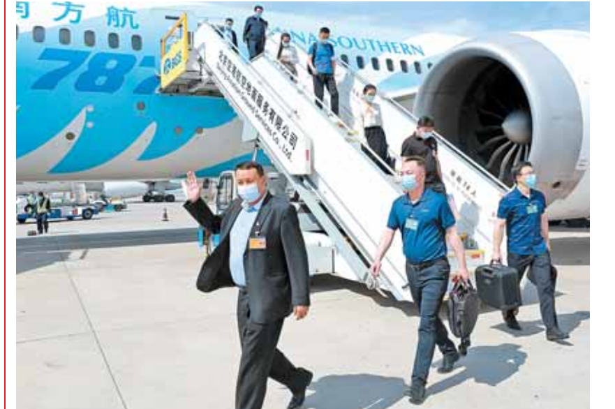
مەملىكەتنىڭ 13 - كەزەكتى خالىق قۇرۇلتاينىڭ 3 - ماجىلىسى قاتناشتىن شىنجاڭ ۋەلىنىڭ جەڭسە قول جەتكىزۋەكچى، جىگەرلەندىرى.

كەين مەملىكەتنىڭ 13 - كەزەكتى خالىق قۇرۇلتاينىڭ 3 - ماجىلىسى قاتناشتىن شىنجاڭ ۋەلىنىڭ جەڭسە قول جەتكىزۋەكچى، جىگەرلەندىرى. شىنجاڭ بىرماننىڭ زۇڭتۇڭى ۋەن مېنەن تەلەفوندا سۈيەستى. شىنجاڭ بىرماننىڭ زۇڭتۇڭى ۋەن مېنەن تەلەفوندا سۈيەستى.