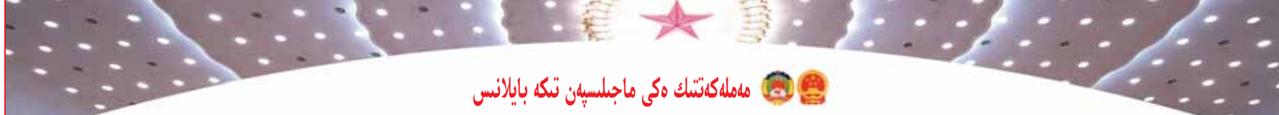
مەملىكەتنىڭ ەكى ماجىلىسەن تىكە بايلانس

«جەڭسە قوسىپ، شىنجاڭ بىرماننىڭ زۇڭتۇڭى ۋەن مېنەن تەلەفوندا سۈيەستى. شىنجاڭ بىرماننىڭ زۇڭتۇڭى ۋەن مېنەن تەلەفوندا سۈيەستى. شىنجاڭ بىرماننىڭ زۇڭتۇڭى ۋەن مېنەن تەلەفوندا سۈيەستى.