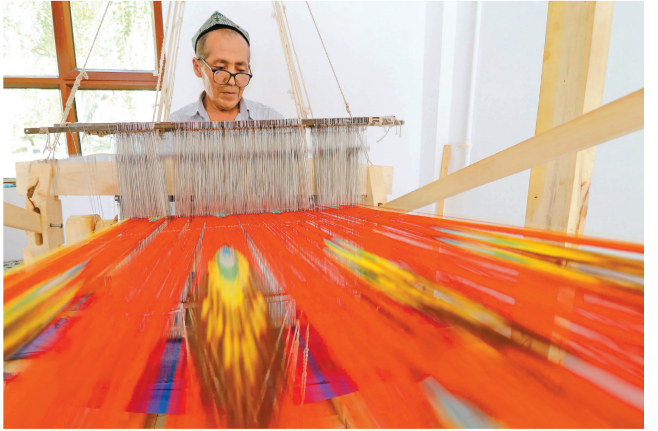
6 - ايدىڭ 13 - كۈنى بەزى تىنچ مادەنىيەت مۇرالارنى جارمەنكەسىندە كورسەتىلگەن ۴اتلاس كەزەمەسىن توقۇ ونەرى. □ سۇرەتتى ساي زىڭلى تۇسرىگەن

بەزى تىنچ مادەنىيەت مۇرالارنى جالغاستىرۇ، ۇگىتتەۋ قىيمىلدا بەزى ات- تىق مادەنىيەت مۇرالارنى جالغاستىرۇعا قاتىستى بەينەكەسكىندەردى كورپ