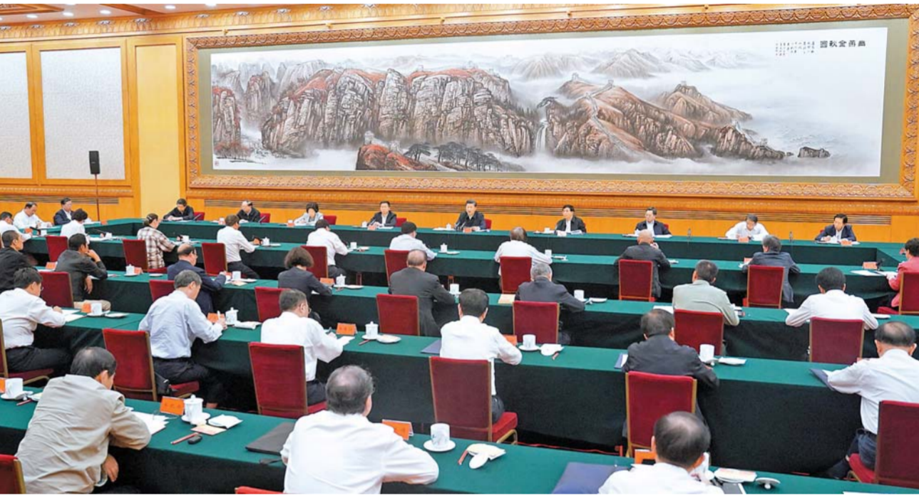
9 - ئاينىڭ 22 - كۈنى چۈنگو كوممۇنىستىك پارتىيىسى ورتالىق كومىتېتىنىڭ باش ۋىزى، مەملىكەت توراعاسى، ورتالىق ئىكەرى سىز كومىتېتىنىڭ توراعاسى شىنجاڭ بەيجىڭدە ۋەقە - ھادىيەت، دەنساۋلىق ساقتاۋ، دەنە تارىيە سالارنىڭ ماماندارى، ۋاڭلەردىڭ كۆمەكىسىمەن باشقارىپ اشىپ، بىلاي دەپ باسا دارىپتەدى ۋەقە - ھادىيەت، دەنساۋلىق ساقتاۋ، دەنە تارىيە سىستىمىنىڭ دامۇشۇن جالىپى بەتتىك ئىلگەرىلەتتى، خالىق بۇقاراسىنىڭ تابىسى سەزىمىن، باقتى سەزىمىن، جاۋىپسۇردىك سەزىمىن ۋەدىكىسز كۆشەيتىۋ كەردەك ۋاڭ خۇنىڭ، خان جىڭ قاتىناستى.

شىنجاڭ ۋەقە - ھادىيەت، دەنساۋلىق ساقتاۋ، دەنە تارىيە سالارنىڭ ماماندارى، ۋاڭلەردىڭ كۆمەكىسىمەن باشقارىپ اشىپ، بىلاي دەپ باسا دارىپتەدى ۋەقە - ھادىيەت، دەنساۋلىق ساقتاۋ، دەنە تارىيە سىستىمىنىڭ دامۇشۇن جالىپى بەتتىك ئىلگەرىلەتتى، خالىق بۇقاراسىنىڭ تابىسى سەزىمىن، باقتى سەزىمىن، جاۋىپسۇردىك سەزىمىن ۋەدىكىسز كۆشەيتىۋ كەردەك ۋاڭ خۇنىڭ، خان جىڭ قاتىناستى.