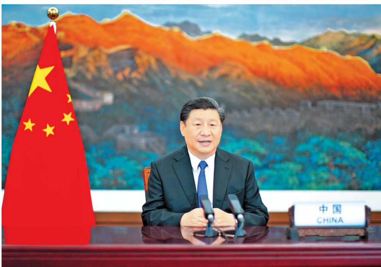
10 - ئايدىكى 1 - كۈنى مەملەكەت ئورمانى شى جىنپىڭ بىرلەشكەن مەملەكەت ۇيىمى جىنالىسىنىڭ بەيجىڭ الەمدىك ايلەلدەر جىنالىسىنىڭ 25 جىلدەن ەسكە الة جوعارى دارە جەللىر ماجىلىسىدە بىنە ەكران ارقتى ماڭىزدى ئسوز سويلەدى. □ سۇرەتى شىنخۇا ئاڭلىشىمىزنىڭ تىلىشى جۇي پەڭ تۇرسەن

ايەلدەردىڭ نىدەتنىڭ نىقالىنان ارىلۇنغا كۆمەكتەسىپ، جىنس تەڭدىگىن ناقتى تىاناقاندىرىپ، ايلەلدەردىڭ ۇداۋردىڭ الدىڭغى لەڭىندە ۇجۇرۇن ئلگىرىلەتسە، ايلەلدەر سىتەرىندەگى الەمدىك سەلبەستىكتى كۇشەيتۇدى دارپتەدى 2025 - جىلى الەمدىك ايلەلدەر جوعارى دارەجەللىر كەڭەسنى تاغى دا اشۇ تۇرالى باسئامالغا قويدى