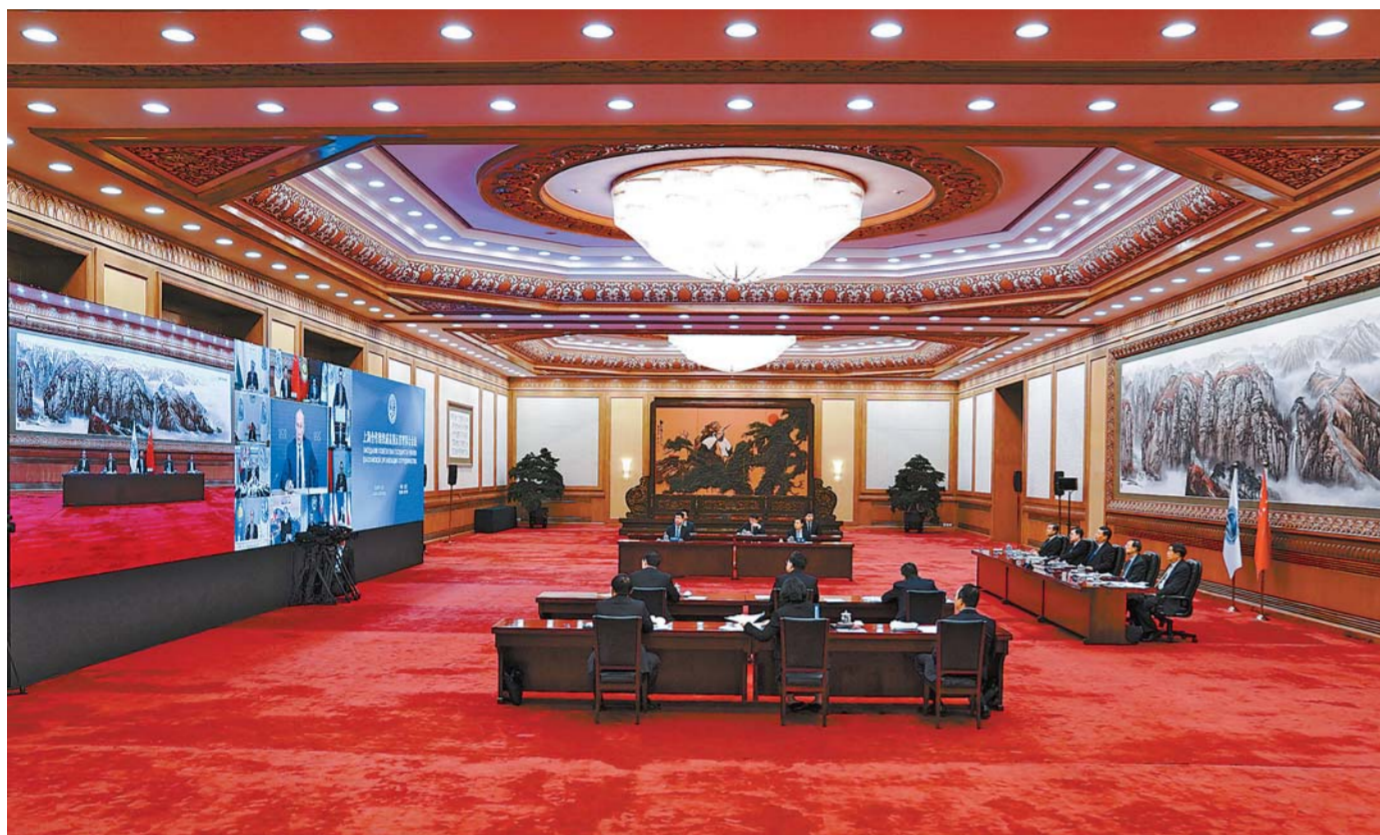
11 - ئايدىڭ 10 - كۈنى كەشتە مەملەكەت ئوراعاسى شى جىنپىڭ بەيجىڭدە بەنە ەكران ئاسلى ارقلى شاڭخاي سەلبەستىك ۋېمىنا مۇشە ەلدەر باسشىلارى القالار كەڭەسنىڭ 20 - رەتكى ماجىلىسى قاتناستى ۋارى ماڭىزدى ئسوز سويلەدى.

شاڭخاي سەلبەستىك ۋېمىنا مۇشە ەلدەر باسشىلارى القالار كەڭەسنىڭ 20 - رەتكى ماجىلىسى قاتناستى ۋارى ماڭىزدى ئسوز سويلەدى. شاڭخاي سەلبەستىك ۋېمىنا مۇشە ەلدەر باسشىلارى القالار كەڭەسنىڭ 20 - رەتكى ماجىلىسى قاتناستى ۋارى ماڭىزدى ئسوز سويلەدى. شاڭخاي سەلبەستىك ۋېمىنا مۇشە ەلدەر باسشىلارى القالار كەڭەسنىڭ 20 - رەتكى ماجىلىسى قاتناستى ۋارى ماڭىزدى ئسوز سويلەدى.