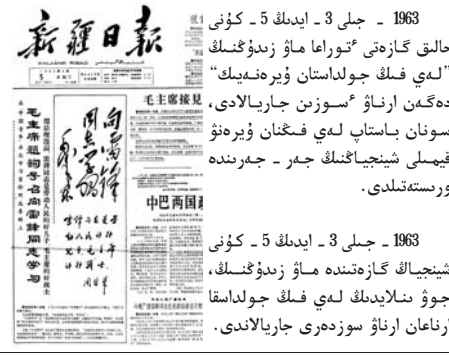
1963 - جىلى 3 - ايدىڭ 5 - كۈنى شىنجاڭ گازەتىدە ماۋ زىدۇڭنىڭ، جۇڭگو ئىنقىلابىدىكى لەي فىڭنىڭ جەمەتتە ارناغان ارناۋ سوزدەرى جارىيالىدى.