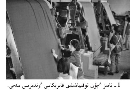
1 - نامىز ئۆل شارۋاشلىق فابرىكاسى ۇندىرىس سەخى.