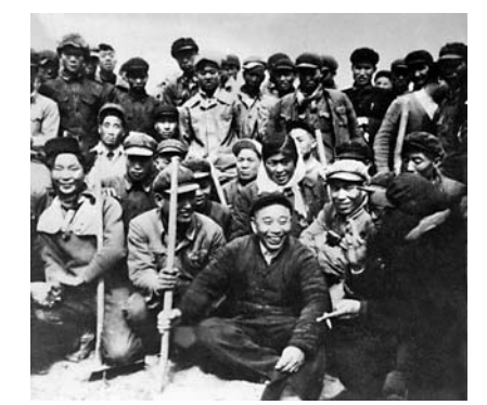
1960 - جىلى ۋاڭ جىن جولىدا بېيڭتۇان ئۆل شارۋاشلىق 1 - شىنىڭ 8 - الاڭىدا تىڭ يىگەرۋ جۇڭگۇدا بىرگە.

1958 - جىلى 7 - ايدا قۇرۇلغان شىنجاڭ كەن قورنۇ شۇەننەننى مەتال قورنۇ ونەركاسىپ مېنىستىرلىكىگە قاراتىلدى، 1966 - جىلى شىنجاڭ ونەركاسىپ شۇەننەننى بولپ اتىن وزگەرتتى. 2000 - جىلى 12 - ايدىڭ 30 - كۈنى بۇردىنى شىنجاڭ داۋەسى مەن بۇردىنى شىنجاڭ ونەركاسىپ شۇەننەننى بىرىكتىرىلپ، جاڭا شىنجاڭ داۋەسى سى بولپ قۇرۇلدى.