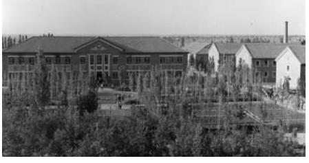
بېيڭتۇان ئۆل شارۋاشلىق شۇەننەننىڭ مەكتەپ اۆلاسى

6 - ايدىڭ 27 - كۈنى ئۆتۈنومىيالى رايوندىق پارتكومنىڭ ەم - كىتۈمىن بېيڭتۇان ئۆل شارۋاشلىقى شۇەننەننى قۇرۇلدى. 11 - ايدىڭ 1 - كۈنى قۇرۇلۇ جىنالىسى وتكىزىلىپ، رەتەسەندە رەسىمى وقۇ باستادى.