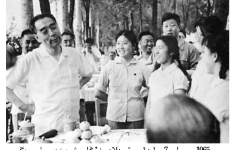
1965 - جىلى 7 - ئايدا جۇڭ نىلاي زۇڭلى شىخىزى باس ەگىس الاڭىندامى رومان بەلدەۋىدە شىنجاڭلىق زىالى جاستاردى قاپلىندا، دى "ارى ولاردى شەكارا ۋىرەنگە الاڭسىز ورنىمەپ، تىڭ يىگەرۇ ۋىرەن قۇرۇعا شىن قىلپەسەن نىتالاندردى.

جۇڭ نىلاي زۇڭلى، ورنىياسار زۇڭلى جىن يى بىڭتۇانغا ارناۋ سوز جازدى: ماۋ زىدۇڭ يىدەياسىنىڭ جەڭسە تۇن بىسك ۇستاپ، شەكارا قورعانىسنا دايىندالىپ، ۋىرەندىس قۇرىلىسىن جۇرگىزىپ، ۇلتلاردى سىتىنچاقسىرتىپ، قاجىرلىقپەن كۇرەس جۇرگىزىپ، قۇلىش نا توڭكەرىس جاساپ، مەركىبەن العا مەلگەلەيلىك!