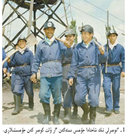
1 - نۇمىرلى تىك شاختادا جۇمىس سىتەگەن "ار ۇلت كورەر كەن جۇمىشلارى.

6 - ئايدىنكى 14 - كۈنى بىڭتۇان پارتكومى سۇن لۇچىندى جۇڭگو كوممۇنىستىك پارتىيىسىنىڭ مۇشەسى دەپ تولقۇتاپ تاند. 8 - ئايدىنكى 25 - كۈنى ئۆتونومىيالىق رايوندىق توڭكەرىستىك كومىتەت ومان "توڭكەرىستىك قارامان" اتامىن بەردى.