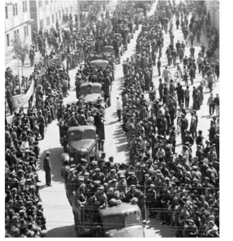
1969 - جىلى 2 - ئايدىنكى 3 - كۈنى "ار ۇلت بۇقاراسى ۇرۋىچى قالاسىنان ئۇل - قىس - تالقارغا بارىن تۇڭغىش تۇپتاي زىالى جاستاردى شان مەرىپەن تىلەردىن سالىدى. وسدان كەيىن بۇكىل شىنجاڭنىڭ جوب - جەرنەن قىرۇار زىيالى جاس ئۇل - قىستاققارغا باردى، بەيەنچى سىياقتى ولگە، قالالاردان دا قىرۇار زىيالى جاس بركەس - تىركەس شىنجاڭغا كەلپ، ئۇل - قىس - تالقارغا باردى.