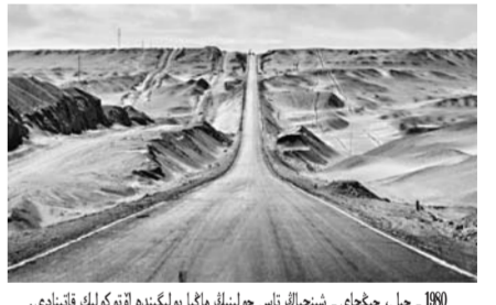
1980 - جىلى، چىڭخاي - شىنجاڭ تاس جولىنىڭ ماڭيا بولمىشە ئۆتوكولىك قاتنىدادى.

1980 - جىلى 11 - ئايدا دەيىن جالىپ ۇزىندىمە 2186 كىلومەتر چىڭخاي - شىنجاڭ تاس جولى سالىنىپ، ئۆتوكولىك قاتنىدادى.