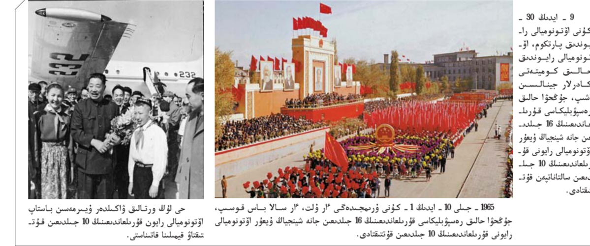
9 - ئايدىنكى 30 - كۈنى ئۆتونومىيالىق رايوندىق پارتكوم، ئۆتونومىيالىق رايوندىق خالىق كومىتەتى كادىرلار جىنالىسىنىڭ ۋىغۇر خالىق رەسپۇبلىكاسى قۇرۇلغاندىنەنكى 16 جىلدىمە، ھەن جانە شىنجاڭ ۋىغۇر رايونى قۇرۇلغاندىنەنكى 10 جىلدىمە سالتاناتىن قۇتتىقتادى.

2 - ئايدا جۇڭگو كوممۇنىستىك پارتىيىسى ورتالىق كومىتەتى شىزاڭ ئۆتونومىيالىق رايونىدا ئۇل شارۋاشلىقى قۇرىلىسى شىشىن قۇرپ، اسكەرى تىڭ يىگەرۇ سىتەرىن داسىتۇدى ۋىغۇردى. جۇڭ نىلاي زۇڭلى: شىنجاڭ ۋىرەندىس - قۇرىلىسى بىڭتۇاننان قۇرىلمىدىق تۇان ۋىمىداستىرپ، شىزاڭ قۇرىلىسىنا ات سالىسىپ، شىزاڭدا مەملەكەت مەشەكتىدەگى ەگىس الاڭىن داسىتۇعا ۇلگى بولۇ كەرەك، - دەپ نۇسقاۋ بەردى.