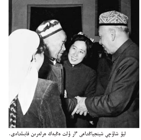
لىۋ شاۋچى شىنجاڭداى "ار ۇلت ەڭبەك مەلەرىن قاپلىدادى.

4 - ئايدىنكى 16 - كۈنى تۇرماما لىۋ شاۋچى مەن زىياسى جانە ورنىياسار زۇڭلى جىن يى باڭكەستاندىمە دوستىق ساپاردى اياقتاتىپ، شىنجاڭغا قايتىپ، حوتان، قانتاز، قىزىلسۇ، ۋۇرۋىچى سىياقتى جەر - لەردى كوزەن كەشكىردى.