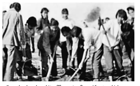
بىڭتۇان نەركاسپ 3 - شىسى 23 - تۇاننىدەمى ايدىل زىيالى جاستار ياركەن وزەنىنىڭ شەسى جاعالاۋىندامى ۇلكەن توعان قۇرۇد. لىس باسندا بايقاشى جۇرگىزۇدە. 8 - ئايدا بىڭتۇان ئۇل شارۋاشلىقى 1 - شىسى "ئىرى تۇرپاتتى جازىق سۇ قويماسى — جەڭس سۇ قويماسى سالىدى، مۇندا 100 مىللىيون تەكشەمەتر سۇ ساقاپ، 100 مىڭ مۇدان اسنام ەگىستىك جەردى سۇارۇعا بولادى.

6 - ئايدىنكى 14 - كۈنى بىڭتۇان پارتكومى سۇن لۇچىندى جۇڭگو كوممۇنىستىك پارتىيىسىنىڭ مۇشەسى دەپ تولقۇتاپ تاند. 8 - ئايدىنكى 25 - كۈنى ئۆتونومىيالىق رايوندىق توڭكەرىستىك كومىتەت ومان "توڭكەرىستىك قارامان" اتامىن بەردى.