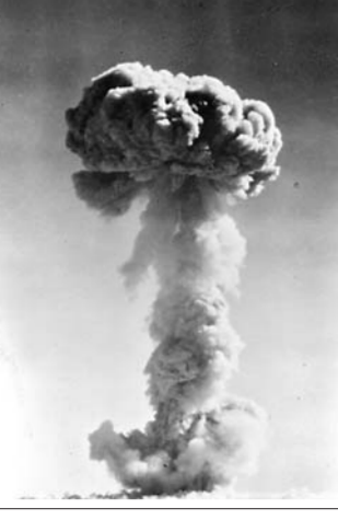
1964 - جىلى 10 - ئايدىنكى 16 - كۈنى ھەلمىز شىنجاڭنىڭ لوپنۇر ۋىرەندە تۇڭغىش اتوم بومبىسىنى ساتتى جاردى.

جۇڭ نىلاي زۇڭلى، ورنىياسار زۇڭلى جىن يى بىڭتۇانغا ارناۋ سوز جازدى: ماۋ زىدۇڭ يىدەياسىنىڭ جەڭسە تۇن بىسك ۇستاپ، شەكارا قورعانىسنا دايىندالىپ، ۋىرەندىس قۇرىلىسىن جۇرگىزىپ، ۇلتلاردى سىتىنچاقسىرتىپ، قاجىرلىقپەن كۇرەس جۇرگىزىپ، قۇلىش نا توڭكەرىس جاساپ، مەركىبەن العا مەلگەلەيلىك!