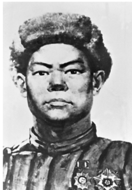
خۇاڭ جيجۇاڭنىڭ سۈرەتى.

1956 - جىلى باستاۋىش مەكتەپ بىستىرگەننەن كەيىن، لەي فىڭ جيانجىياتاڭ ەۋندىرىسى دۇپىندە ۋىل شارۋاشلىق وندىرىسىنە قاتناسىپ، ەسەپشى، ۋىلدىق ۇكە-مەتتىڭ خابارشىسىنان ۋاداندىق پارتكومنىڭ ۇكە-مەت قىزمەتكەرى جانە تۇانشانخۇ ەگىسى الاڭ-نىڭ ترانكتورشىسى بولسى جەتىلەدى. 1958 - جىلى لەي فىڭ ”وتانىمىزدىڭ ەڭ اڭ-بىندى دىنىنە“ ات سالىسۇعا بەل بۇيىپ، تايىسال-جاستان قىزمەت ورتاسى مەن كلىمات شارىت - جاعدايى وتە جايىسىز لياۋنيڭنىڭ انگاڭنانا كەلىپ قىزمەت سىتەپ، شاكىرت بولۇدان باستاپ