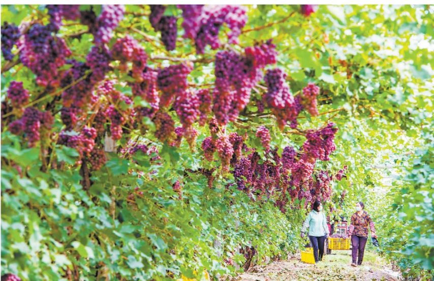
سانجى قالاسى داشىجۇي قالاشىي يۇنتاڭ قىستامى چىشىن سەلبەستىك كووپەراتىۋنىڭ مۇشەلەرى ٴجۇزم جىناۋدا 8۱ - ايدىڭ 30 - كۇنى تۇسىرلەنگەن.

— جەمىس ورمانى ونمىدەرىن ساتۇ تۇرالى جەلىلەس خابار (3)