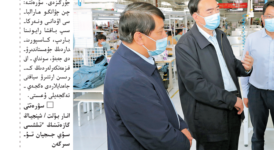
چىن چۈنگو قاشقار ايماعىدا تەكشۈرۈ - زەرتتەۋ جۇرگىزگەندە بىلاي دەپ باسا دارىپتەدى.

چىن چۈنگو قاشقار ايماعىدا تەكشۈرۈ - زەرتتەۋ جۇرگىزگەندە بىلاي دەپ باسا دارىپتەدى. ھالقارادىكى دوستلاردىكى تۇرس - تۇعاندارنا جاۋاپ ھات قايتاردى.