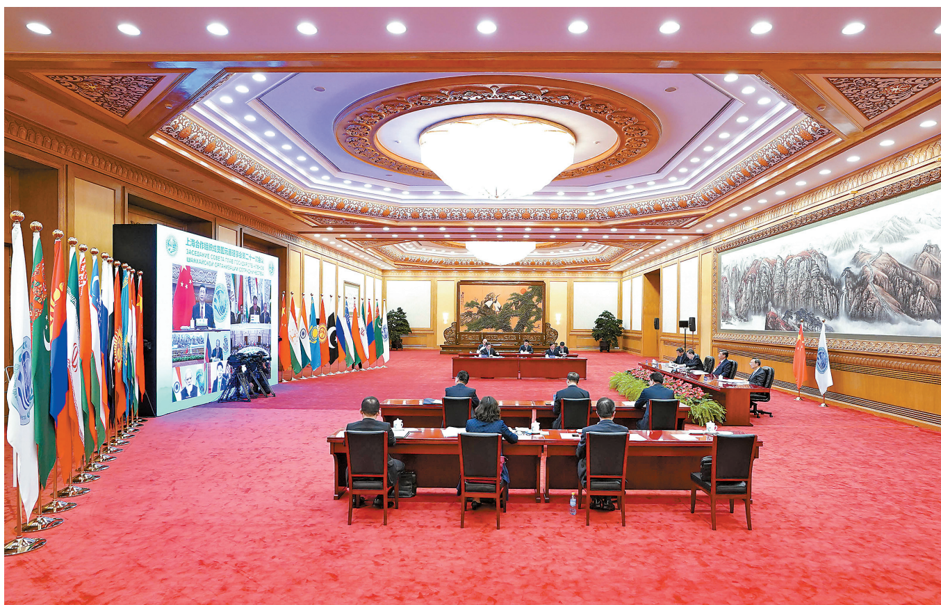
9 - ئاينىڭ 17 - كۈنى مەملەكەت ئوراعى شىنجاڭنىڭ بەيجىڭدە بەينە ھەران تاسلىمەن شاڭخاي سەلبەستىك ۋېمىنى مۇشە ھەلەدەر مەملەكەت باشلىرى ئالار كەڭەسنىڭ 21 - رەتلىك ماھىلىسىدە قاتناشتى ۋىسى ارادان كەلگەمىز. سۆز سۆيلەدى.

شاڭخاي سەلبەستىك ۋېمىنىنىڭ “شاڭخاي رۇھى” تۇن بىك ۋىستاپ، شاڭخاي سەلبەستىك ۋېمىنىنىڭ ئانغۇرلىم تىغىز تاغدىرلاس ورتاق تۇلغاسىن ورناتۇ كەرەكتىكىن باسا دارىپتەدى