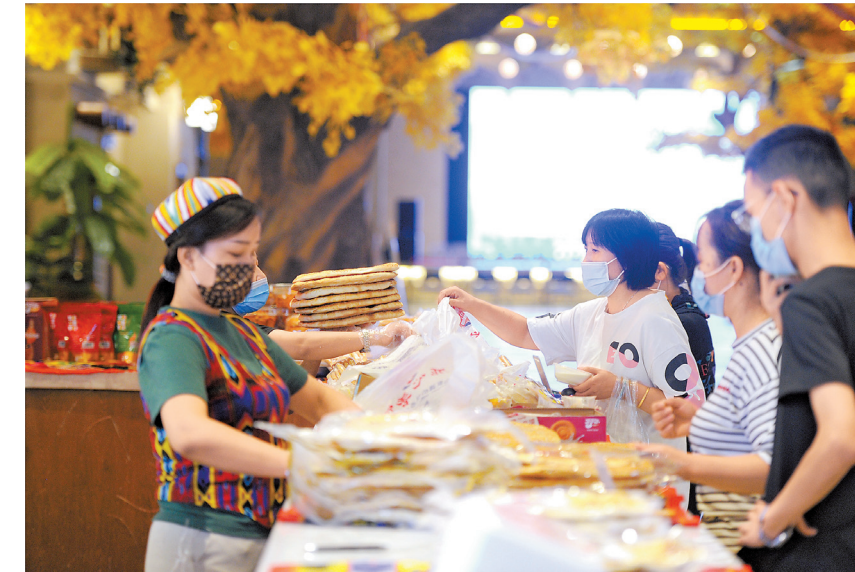
9 - ئاينىڭ 22 - كۈنى ساپاحاتشىلار ۇرمىجى قالاىسى نان مادەنىيەتى كاسىپ سالاىسى باقشاسىندا نان ونەمدەرىن ساتىپ اۋىدا.

اۋماى، ساپاحاتشالارغا قىزمەت ەتەۋ و - تالىقى سىياقتى 12 اۋماقتى ساپالاندۈرۈپ، دارەجەسىن جوعارىلانىپ، كورنىس سە - زىمىن، جۇيەلىك سەزىمىن، باستان