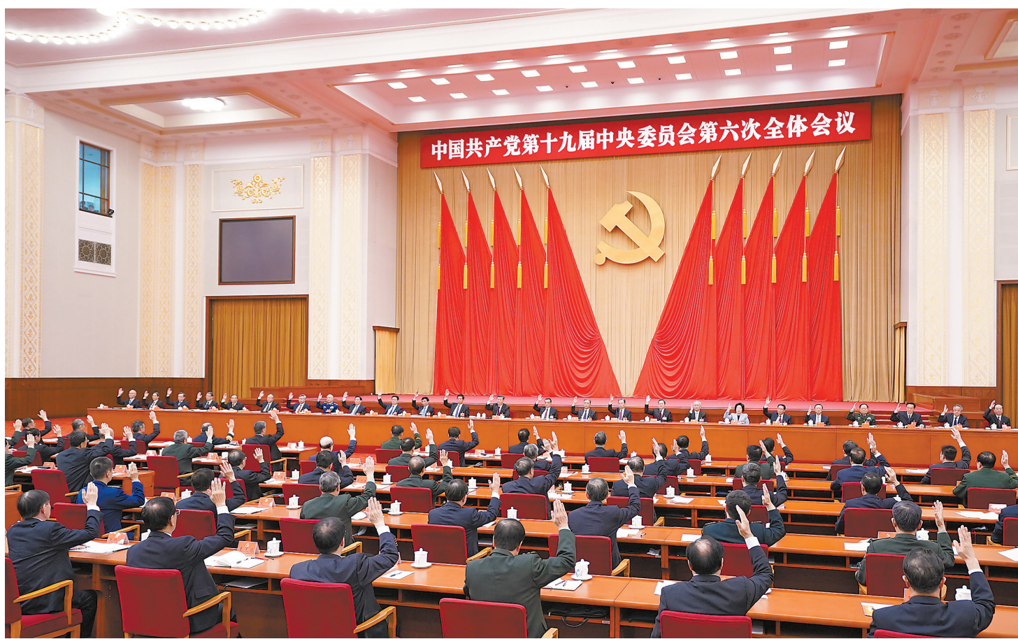
جۇڭگو كوممۇنىستىك پارتىياسى 19 - كەزەكتى ورتالىق كومىتەتنىڭ تىنشى جالىپى ماجىلىسى 2021 - جىلى 11 - ئايدا 8 - كۈنىدە دەپن بەيجىڭدە وتكىزىلدى. ورتالىق كومىتەت ساياسىي بىۋروسى ماجىلىسى باسقاردى.

جالپى ماجىلىسى شى جىنپىڭنىڭ ورتالىق كومىتەت ساياسىي بىۋروسىنىڭ تاپسىرۇمەن جاساعان قىزمەت بايانداماسىن تىڭدادى جانە تالقىلدى. جالىپى ماجىلىسى «جۇڭگو كوممۇنىستىك پارتىياسى ورتالىق كومىتەتنىڭ پارتىيانىڭ 100 جىلدىق كۇرەسىنىڭ كەلەلى تاپسىتارى مەن تارىخى تاجىرىبەلەرى تۇرالى قارار» قاراپ ماقۇلدادى، «پارتىيانىڭ مەملەكەتتىك 20 - قۇرىلتاين اشۇ تۇرالى قارار» قاراپ ماقۇلدادى. شى جىنپىڭ «جۇڭگو كوممۇنىستىك پارتىياسى ورتالىق كومىتەتنىڭ پارتىيانىڭ 100 جىلدىق كۇرەسىنىڭ كەلەلى تاپسىتارى مەن تارىخى تاجىرىبەلەرى تۇرالى قارارى (تالىقى نۇسقا)» جونىدە جالىپى ماجىلىسىگە تۇسنىك جاسادى. جالىپى ماجىلىسى ورتالىق كومىتەت ساياسىي بىۋروسىنىڭ پارتىيا 19 - كەزەكتى ورتالىق كومىتەتنىڭ بەسىنشى جالىپى ماجىلىسىنەن بەرگى قىزمەتتەرىن تولۇق تۇراقتاندىردى. جۇڭگو كوممۇنىستىك پارتىياسى مەملەكەتتىك 20 - قۇرىلتاين 2022 - جىلدىڭ سوڭى جارىمىندا بەيجىڭدە اشۇدى ۇيغاردى