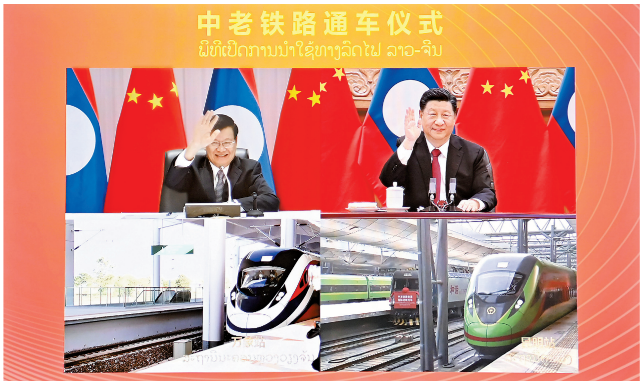
中老铁路通车仪式