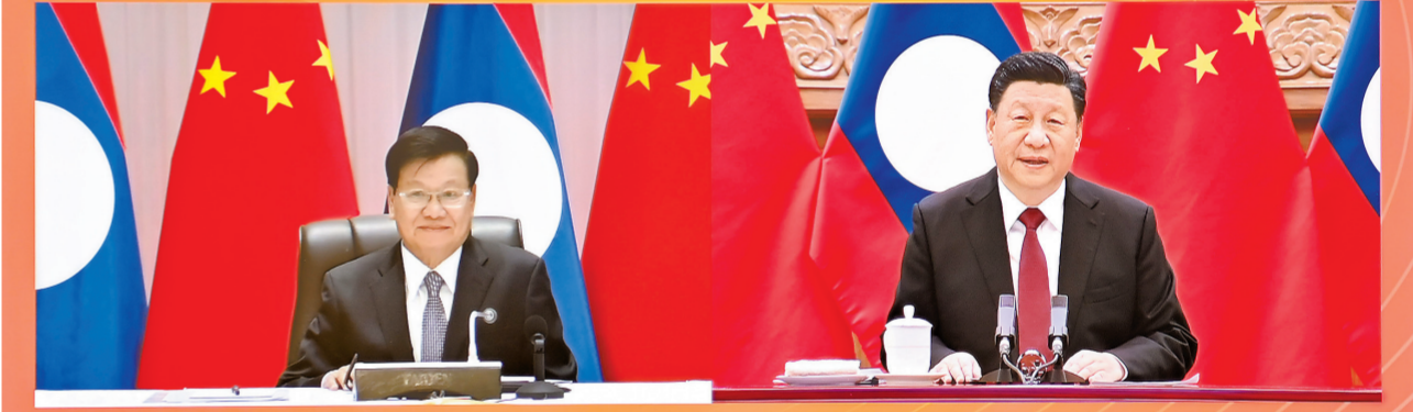
12 - ئايدا 3 - كۇنى جۇڭگو كوممۇنىستىك پارتىياسى ورتالىق كومىتېتىنىڭ باس شۆجىي، مەملەكەت ئوراعاسى ئوڭگۈنمەن بىرگە ەكراندا دىدارلاستى.