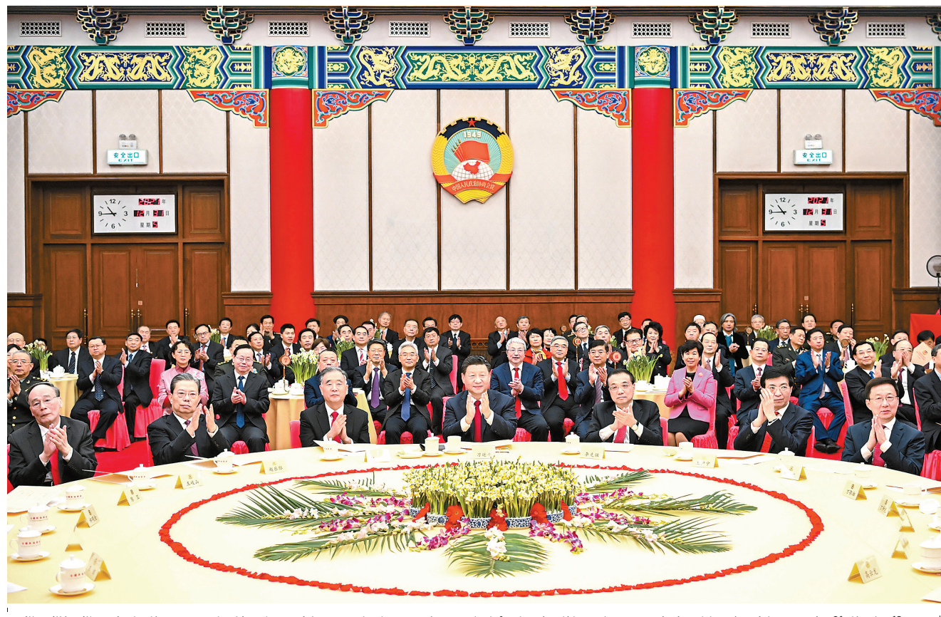
12 - ايدىڭ 31 - كۈنى مەملەكەتتىك ساياسىي كەڭەس بەيجىڭدە جاڭا جىل شاي ۇماجلىسىن وتكىزدى. پارتىيا مەن مەملەكەت باسشىلارنىن شى جىنپىڭ، لي كىچياڭ، ۋاڭ ياڭ، ۋاڭ خۇنىڭ، جاۋ لىجى، خان جىڭ، ۋاڭ چىشان شاي ۇماجلىسىنە قاتنىستى ۇزى كونسەرت كوردى. □ سۆزەتنى شىنخۇئا اگەنتىگىنىڭ تىلشىسى يان يان تۇسەرگەن

شىنخۇئا اگەنتىگىنىڭ 12 - ايدىڭ 31 - كۈنى بەيجىڭنەن بەرگەن خابارى. جۇڭگو خالىق ساياسىي ۇماجلىحات كەڭەسى مەملەكەتتىك كومىتەتنى 12 - ايدىڭ 31 - كۈنى تۇستەن بۇرىن مەملەكەتتىك ساياسىي كەڭەس زالىندا جاڭا جىل شاي ۇماجلىسىن وتكىزدى. پارتىيا مەن مەملەكەت كەت باسشىلارنىن شى جىنپىڭ، لي كىچياڭ، ۋاڭ ياڭ، ۋاڭ خۇنىڭ، جاۋ لىجى، خان جىڭ، ۋاڭ چىشان قاتار - لىلار ۇزقايسى دەموكراتىلىق پارتىيا - توپتار ورتالىق كومىتەتتەرنىڭ، مەملەكەتتىك ساۋدا - ونەر كاسپىشلىرى بىر - لەستىگىنىڭ جاۋاپكارلىرىمەن جانە پارتىيادا، توپتا جوق قايراتكەرلەردىڭ ۋاكتىلەرد - مەن، ورتالىق پەن مەملەكەت وركاندار - نىڭ قاتنىستى جاققاندىعى جاۋاپكارلىرى - مەن، سونداي - اق استاناداعى ۇز ۇلت، ۇز سالا قايراتكەرلەرنىڭ ۋاكتىلەرىمەن ۇبر اراعا شاتتىقپەن باس قوسپ، 2022 - جىلى جاڭا جىل مەرمەكەسەن بىرگە قارسى الدى. □ سۆزەتنى شىنخۇئا اگەنتىگىنىڭ تىلشىسى يان يان تۇسەرگەن (جالعاسى 3 - بەتتە)