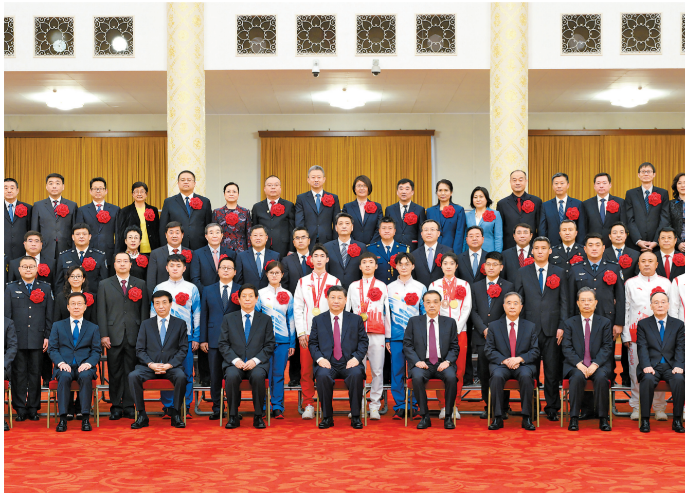
بەيجىڭ قىسقى ۋىلەيىدا سېورت جارىسىن، مۇگەدەكتەر قىسقى ۋىلەيىدا سېورت جارىسىن قورنىدىلا، ماداقتاۋ - سىلاۋ جىنالىسى سالتان تېن وتكىزىلدى. ۋىتنام ۋە شىنجاڭنىڭ ئوتتۇرىسىدا تەلەپ-تەلەپ قىلىنىشى مۇھىم.

لى كىچىڭ باسقاردى، لى جانىشۇ، ۋاڭ ياك، ۋاڭ خۇنىڭ، جاۋ لىجى، ۋاڭ چىشان قاتنىشى، جان جىڭ ماداقتاۋ - سىلاۋ قاۋلىسىنى وقىدى