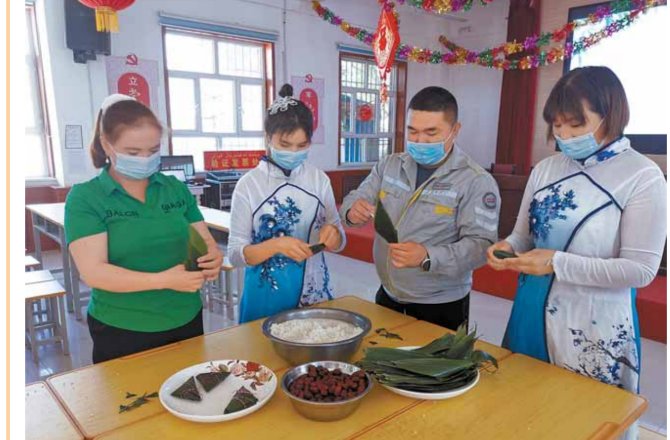
قىياق كۇرۇشنىڭ خوش بىسىمەن دۇان - ۇدى قارىسالىدى. ەندىرەمەن بىرگە قىياق كۇرۇش ئۇيىپ، دۇان - ۇ مەرەكەسەن بىرگە قارىسالىدى.