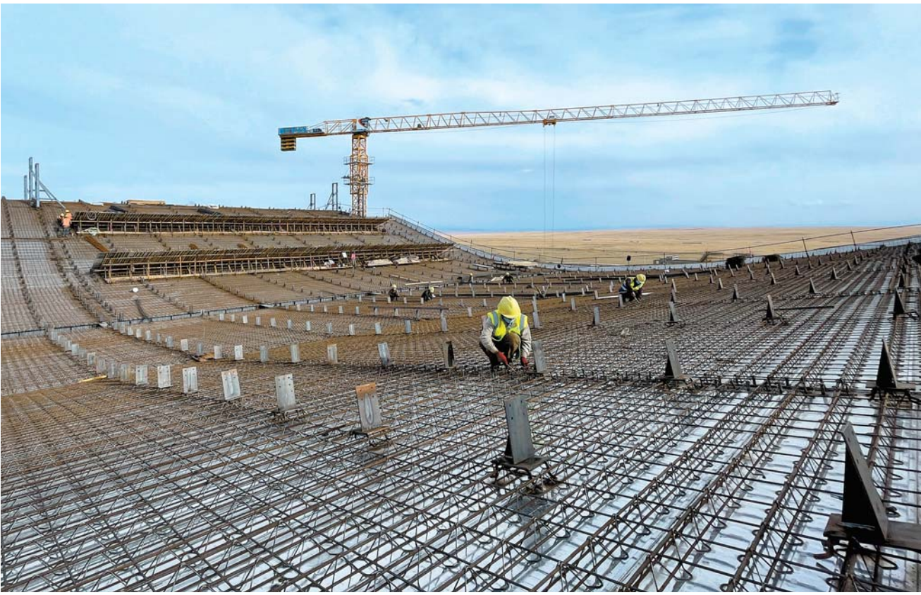
10 - ايدىڭ 8 - كۈنى جۇمىسشىلار بايىنبۇلاق اۋەجايى نىسانىنىڭ جاڭادان سالناتىن تەرمىنال عىماراتىنىڭ جۇمىس باسندا جۇمىس جۇرگىزۋدە. سوغى مەزگىلدەردە نىدەتتەن ساقناۋ - تىزگىندەۋىدە ويداعىداي سىتەۋ الى شارىندا، قۇرىلىس جۇرگىزۋشى ورن ۋستەمەلەپ جۇمىس سىتەپ قۇرىلىس ۋاقتىن ۋتەپ، وسى ايدىڭ سوغىنان بۇرىن جاڭادان سالناتىن تەرمىنال عىماراتىنىڭ نەگىز - گى يولات قۇرىلمىدى توبەسىن تولق جابۇعا شىناي كەپىلىك ەتتى.

انار بۇلت \ شىنجاڭ گازەتنىڭ ئەملىسى رىن جىياڭ 10 - ايدىڭ 8 - كۈنى ۋرېمىجىدەن خاىبارلايدى. "تاۋ - وزەندەرى تاماشا"، "تۇنىق سۇ، جاسىل تاۋ، تابىعاتى تاماشا"، "جاقسى جەر، جاقسى كورنىسى"، "اتلانت مۇحىتىنىڭ سوغىسى ۋرېر تامشى كوز جاسى نەتكەن ادەمى دى، تاى ۋرېر رەت بارىم كەلەدى" ... بىيل مەملە - كەت مەرەكەسى كەزىندە ئۆتونومىيالى رايوندىق پارتكوم ۋكىت ۋبولىمىنىڭ جەتەكلىگىندە، شىنجاڭ گازەتى مە - كەمەسى (شىنجاڭ گازەتنىڭ تاراتۇ مەدىياسى تۇبى)، شىنجاڭ رادىيو - تە - لەۋىزىيا ستانىياسى ۋارقايسى ايماق (بولىس، قالا)، اۋدان (قالا) توعىسپالى ايتقارات ورتالىقىمەن قول ۋستاسىپ شە - ھارغان "كوكىلچىم سۇ، كوكىلدىر تاۋ - شىنجاڭغا نازار" جالپىلىق مەدىيالار نە - گىزگى تاقىرىپتىق ۋكىت قىمىلى جايپاي ورسىتەتلىگەننەن كەيىن، شىنجاڭنىڭ كوركەم كورنىسىتەرى، اۋان ماۋمۇد - دى كۇمانىپارتلىق دۇنيەلەرى، باقتىسى تۇرمىسى، قوعامنىڭ دامۇى جويندەگى