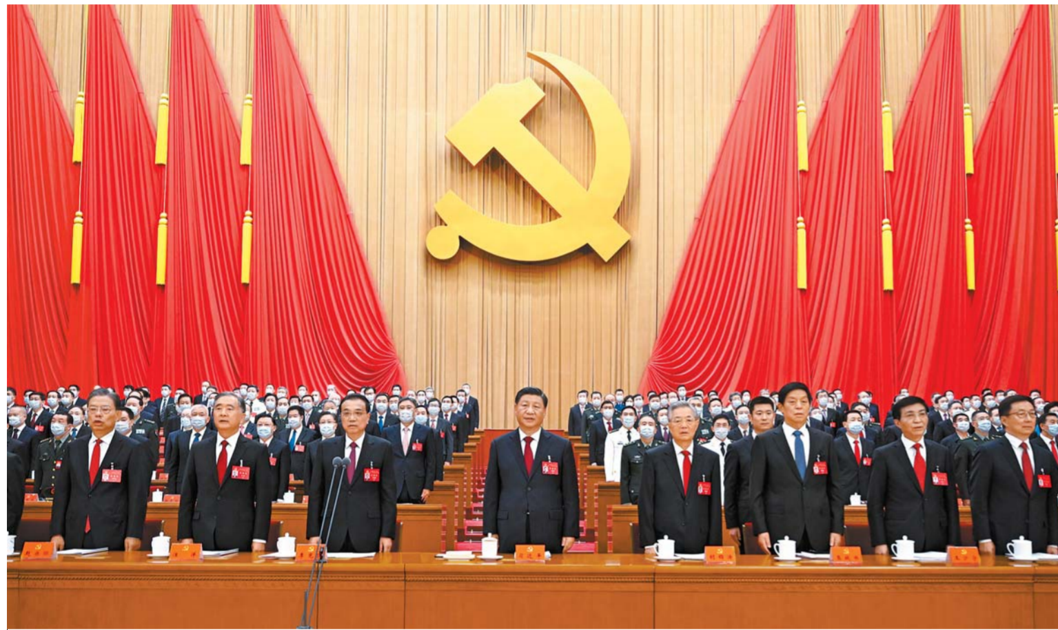
10 - ئاينىڭ 16 - كۇنى جۇڭگو كوممۇنىستىك پارتىيىسىنىڭ مەملەكەتتىكى 20 - قۇرۇلتايسى بەيجىڭدا باشلىدى. سۇرەتتە: شى جىنپىڭ، لى كىچىڭ، لى جىنشۇ، ۋاڭ يان، ۋاڭ جۇنىڭ، جاۋ لىجى، جان جىڭ، ۋە جىنجاۋ تۇرغالار مەنبەسىدىن ورنىدى. □ سۇرەتتى شىنخۇا اگەنتىنىڭ تىلشىسى لى شۇەرن تۇسىرگەن

شى جىنپىڭ بىلاي دەپ اتاپ كورسەتتى: قازىردەن باسساپ، جۇڭگو كوممۇنىستىك پارتىيىسىنىڭ وزەكتى مىندەتتى — بۇكىل ەلدەگى ەر ۇلت حالقىن ئىتتىپاقىداستىرىپ جانە باسساپ، جاپپاي سوتسىيالىستىك وسزاماندانغان قۇدرەتتى مەملەكەت قۇرۇپ شىعەپ، ەكىنشى 100 جىلدىق كۇرەس نىساناسىن جۇزەگە اسرىپ، جۇڭخۇا ۇلتىنىڭ ۇلى گۈلدەنۇن جۇڭگو ۇلتىسىندەگى وسزامانداندىرۇ ارقىلى جاپپاي بىلگەرلەتۇ. العا باسۇ جولىندا مىناداي كەلەلى پرىنسىپتەردى، ەسوز جوق، مىقتى يەگەرۋىمىز كەرەك: پارتىيىنىڭ جالىپى بەتتىك باسشىلىغىدا تاباندى بولۇ جانە ونى كۇشەيتۇ، جۇڭگوشا سوتسىيالىزىم جولىندا تاباندى بولۇ، حالقىتى وزەك ەتكەن دامۇ يدەياسىدا تاباندى بولۇ، رەفورمىلاۋ، ەسىك اشۇدى تەرەڭدەتۇگە تاباندى بولۇ، كۇرەسكەرلىك رۇختى ساۋلەلەندىرۇگە تاباندى بولۇ لى كىچىڭ قۇرۇلتايدى باسقاردى، 2340 ۋاكىل جانە ۇسىنىس ەتىلگەن ۋاكىل قۇرۇلتايعا قاتنىاستى