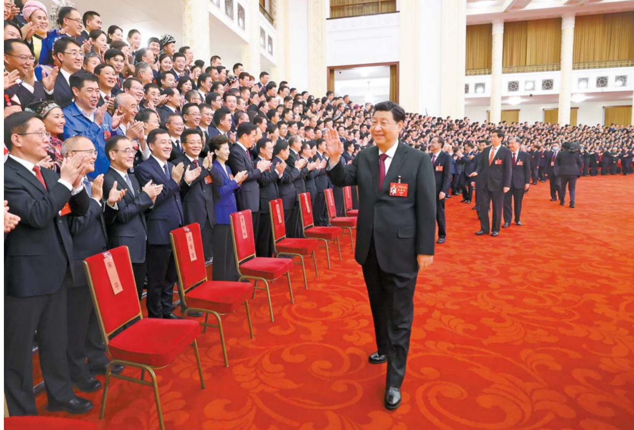
10 - ايدىڭ 23 - كۈنى تۇسەن كەينى جۇڭگو كوممۇنىستىك پارتىيىسى ورتالىق كومىتېتىنىڭ باش شۇجىسى، مەملەكەت ئورگانى، ورتالىق اسكەرىي سەھەر كومىتېتىنىڭ ئورگانى شى جىنپىڭ قاتارلىق باشى جۇداستار بەيجىڭدا چاقىرىلغان پارتىيىسى 20 - قۇرۇلتاينىڭ قاتناشقان ۋەلگەلەر مەن جەنە سىرتى قاتناشقانلار مەن سىتقىن قىلاسەن كەزدەستى ۋەلى كۆپلىكىپەن سۆھرەتتە تۇسەن تۇسەن ھەتەلەكەت قالدردى. □ سۆھرەتى شىنخۇا اگەنتىگىنىڭ تىلشىسى جۇي پىڭ تۇسرىگەن