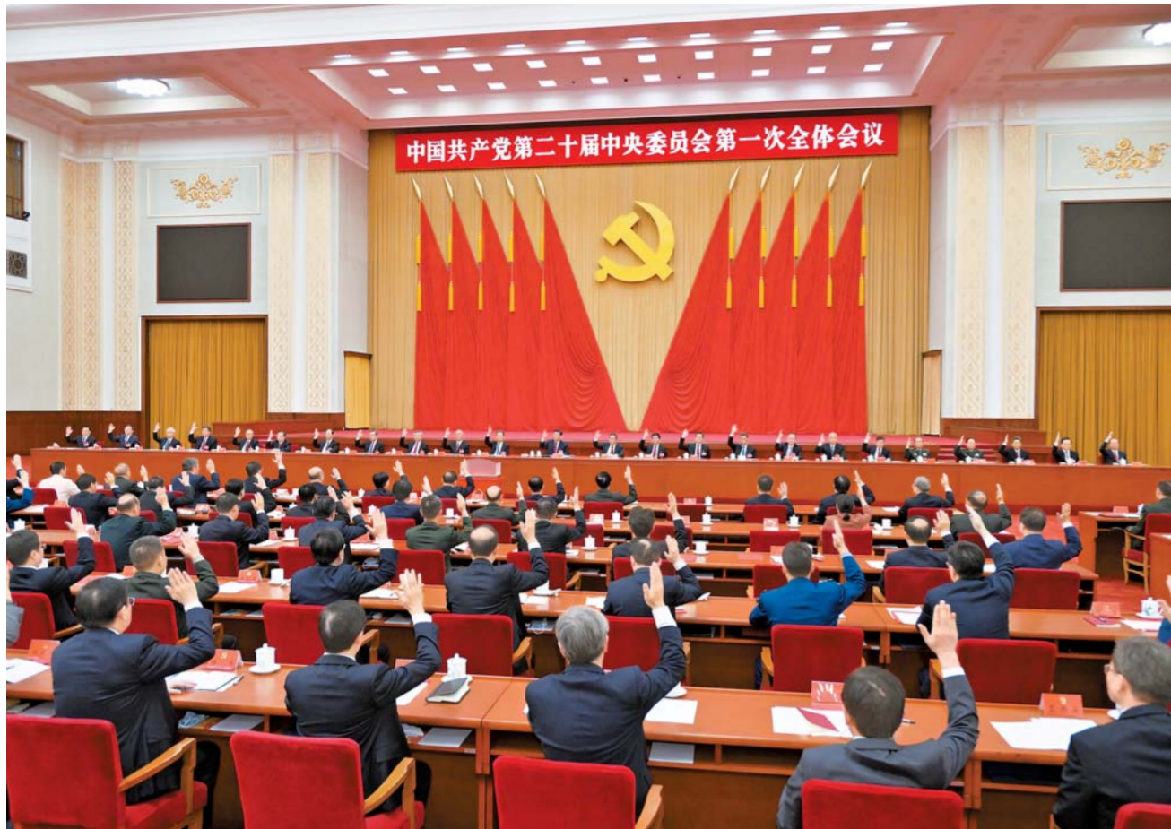
10 - ايدىڭ 23 - كۈنى جۇڭگو كوممۇنىستىك پارتىيىسى 20 - كەزەكتى ورتالىق كومىتېتىنىڭ بىرىنچى جالىي مەجلىسى بەيجىڭدا چاقىرىلدى. شى جىنپىڭ جۇڭگو كوممۇنىستىك پارتىيىسى ورتالىق كومىتېتىنىڭ باش شۇجىسى بولۇپ سايبانغان كەينى مەزگىلدىكى سۆز سۆيلىدى. □ سۆھرەتى شىنخۇا اگەنتىگىنىڭ تىلشىسى جۇي پىڭ تۇسرىگەن