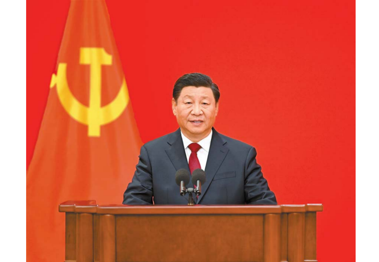
10 - ايدىڭ 23 - كۈنى ھەلەكەت جۇڭگو كوممۇنىستىك پارتىيىسى 20 - كەزەكتى ورتالىق كومىتېتىنىڭ بىرىنچى جالىي مەجلىسىدە سايبانغان جۇڭگو كوممۇنىستىك پارتىيىسى ورتالىق كومىتېتىنىڭ باش شۇجىسى شى جىنپىڭ جۇڭگو كوممۇنىستىك پارتىيىسى ورتالىق كومىتېتى ساياسىي بىيۇروسى تۇراقلىق كومىتېتىنىڭ مۇشەھەرلىرى لي جياڭ، جاۋ لىجى، ۋاڭ خۇيىڭ، ساي جى، دىڭ شۇەشياڭ، لي شى بەيجىڭدا چاقىرىلغان جۇڭگو كوممۇنىستىك پارتىيىسى 20 - قۇرۇلتاينىڭ تىلشىسى جاساغان جۇڭگولۇق، شەتەلدىك تىلشەلمەن سىتقىن قىلاسەن كەزدەستى. سۆھرەت: شى جىنپىڭ ماڭزىدىكى سۆز سۆيلىۋەتتە. □ سۆھرەتى شىنخۇا اگەنتىگىنىڭ تىلشىسى لي شۇەرن تۇسرىگەن

بۇكىل پارتىيىنىڭ، بۇكىل ھەلەگى ۋار ۋەل ھالىقنىڭ بىرگە قۇلىنىشۇنىڭ ارقاسىدا، بىز جايپايى دۆڭگەلەك داۋەلتى قوعامدى ۋەل ۋەلدا ۋەلدا ۋەلدا، بىرىنچى 100 جىلدىق كۇرەس نىساناسىن جۇزەگە اسىردىق. قازىر بىز جايپايى سوتسىيالىستىك وسزىماندانان - مان مەملەكەت قۇرۇۋەلگەن جۇڭگو جۇڭخۇا جۇڭخۇا تاسقىنداغان جىگەرەمەن قادم تاستاپ، ھەكىشى 100 جىلدىق كۇرەس نىساناسىنا قاراي جورىق جاساپ، جۇڭگو ۋەلگىسىدەگى وسزىمانداندىرۇۋ ارقىلى جۇڭخۇا ۋەللىنىڭ ۋەلى گۈلدەنۈش جايپايىلىكلىرى تەكشۈرۈلگەن. جۇڭگو جۇڭخۇا بىز اسقاق بەينەمەن ھەكىندەيلىكلىرى بىلەن رۇھانى كۇيدى باستان - اياق ساقاۋۇمىز كەرەك. جۇڭگو جۇڭخۇا بىز بارلىق ھالىق ۋەشىن سىتەۋگە، بارلىقىدا ھالىققا سۈيەنەرگە باستان - اياق تاباندى بولۇمىز كەرەك. جۇڭگو جۇڭخۇا بىز پارتىيىنىڭ وزىنە - ۋەلى توڭگەرسى جاساۋۇن باستان - اياق ۋەلگەلەر تەكشۈرۈلگەن. جۇڭگو جۇڭخۇا بىز بۇكىل ادامزاتقا ۋەللىنىشۇنى باستان - اياق ساقاۋۇمىز كەرەك. جۇڭخۇا ۋەللىنىڭ دامۇ دەنە جۇزىنەن قول ۋە ھەلەيدى، دۇنيە جۇزىنىڭ دامۇ دا جۇڭخۇا قاجەت ھەلەيدى. جۇڭخۇا جورىق - داڭق پەن ارمانغا تولى ۋەللىنىشۇنى. ۋەلى جۇبا جاسالدى، دابىل دەھقانسان قاعىلدى. بىز اسقاق جىگەرەمەن قايراتانان ۋەللىنىشۇن، ھەلەكەتلىك ھەلەكەتلىك بولاشقا جاراتۇعا قۇلىنىشۇمىز كەرەك.