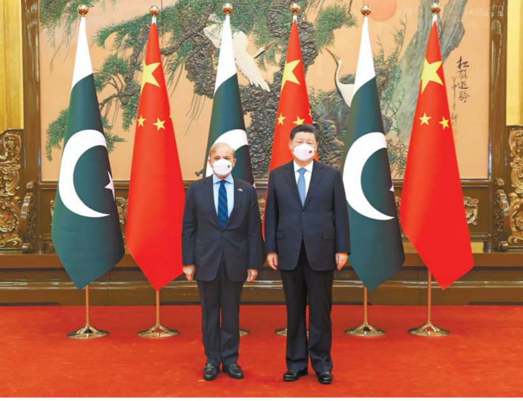
11 - ئايدا 2 - كۈنى تۇستەن بۇرىن، مەملىكەت توراعاسى شى جىنپىڭ بەيجىڭ خالىق ساراينىدا جۇڭگو رەسىمى ساپار- مەن كەلگەن پاكىستاننىڭ زۇڭلى شىھابزەبەن كەزەدەستى. □ سۇرەتتى شىنخۇا اگەنتىگىنىڭ ئىشلىشى ياۋ دا - ۇي تۇسرگەن

شى جىنپىڭ بىلاي دەپ باسا دارىپتەدى: جۇڭگو جاق پاكىستان جاقىنىڭ جۇڭگومەن دوستىق سەلبەستىكى تاباتىلىقىپەن لىكەرلەت- كەندىگىن القايىدى، پاكىستان جاقىنىڭ جۇڭ- گونىڭ وزەكتى مۇددە- سىنە ساپاتىن جانە ۇجىتى قاداغالاپ وتىر- غان كەلەلى ماسەلەلەر- دە جۇڭگو جاقىنى قول- باغاندىنەن العىس ايتا- دى، پاكىستان جاقىنىڭ مەملەكەتنىڭ يەلىك وقى مەن تەرىپتورىيا تۇتاستىن، داۋ مۇددەسىن، ۇلىتىڭ ار - نامىسىن قورعاۋىن باتىل قولدايدى، پاكىستاننىڭ ورنىقىلىقى، نىتھاقى، دامۇدى، گۈلدەنۋدى جۇزەگە اسرۇىن باتىل قولدايدى. جۇڭگو جاق پاكىستان خالقىنىڭ ەرەكشە ۇلكەن تاسقىن اپاتىنا ۇشراغاندىنەن ايرىقسا جان اشلىق بىلدىرەدى، ۇستەملەپ شۇمىل كۆمەك بەرىپ، پاكىستاننىڭ اپاتىن كەينىگى قايتا قۇرۇنا كۆمەكتە- سىپ، پاكىستان جاقىنىڭ اپاتىن كەينىگى ۇل شارۋاشلىقى ۇندىرىسىن قالىپنا كەلتىرۋەنە قولداۋ كۆرسەتسپ، اپاتىن ساققانۇ، اپات زىيانىن ازايىتۇ، كلىمات وزگەرسىنە توتەپ بەرۇ سەلبەستىگىن كۇشەيتەدى.