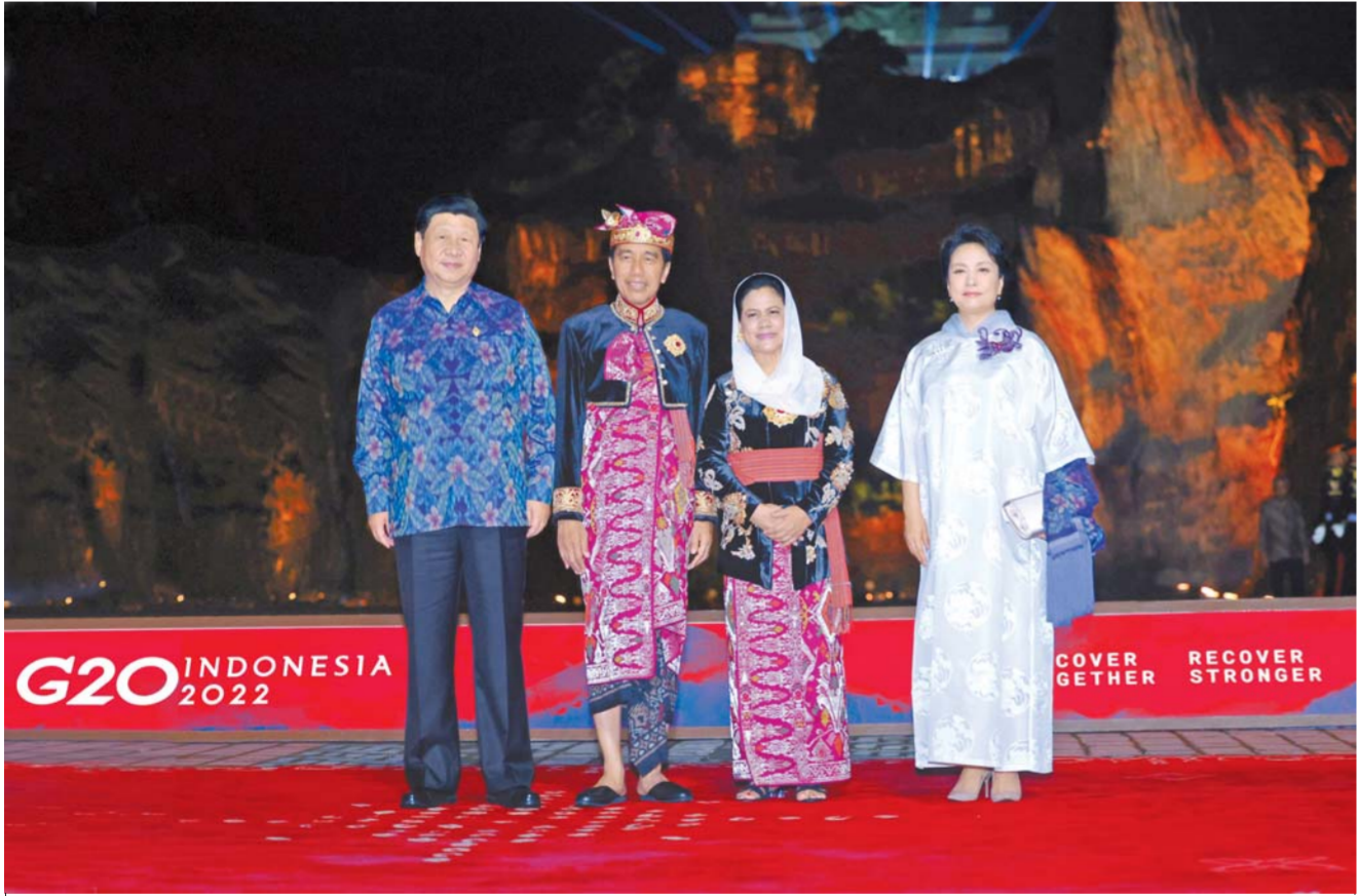
جەرگىلىكتى ۋاقت 11 - ئايدىڭ 15 - كۈنى كەشتە مەملىكەت ئوتوراعىسى شى جىنپىڭ مەن خانىمى پىڭ لىيۇان يىنۇنەنەزىيانىڭ بالى ارالىندا 20 ەل تۈبى باسشىلارنىڭ باسشىلار ماجىلىسىدەگى قارسى الپ كەشكى قوناعاسىنا قاتناستى. سۇرەتتە: ئوتوراعى شى جىنپىڭ مەن خانىمى كەشكى قوناعاسىدان لىگەرى يىنۇنەنەزىيانىڭ زۇڭتۇڭى جۇ جۇ جانە ونىڭ خانىمىمەن تۈپتىق سۇرەتكە ئۇستى. □ سۇرەتنى شىنخۇا اگەنتىگىنىڭ تىلشىسى جۇي پىڭ تۇسىرگەن