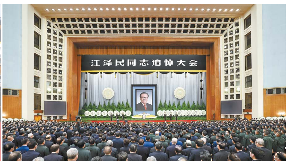
12 - ايدىڭ 6 - كۇنى جۇڭگو كوممۇنىستىك پارتياسى ورتالىق كومىتەتى، مەملەكەتتىك خالىق قۇرۇلتايى تۇراقتى كومىتەتى، مەملەكەتتىك كەڭەس، مەملەكەتتىك ساياسىي كەڭەس، ورتالىق اسكەرىي سىتەر كومىتەتى بەيجىڭ خالىق سارايندا جياڭ زىمىن جولداسقا ۇاڭ خۇنىڭ، خان جىڭ، ساي چى، دىڭ شۇەشياڭ، لى شى، ۇاڭ چىشان قاتارلىقلار جىنالىسىدا قاتناستى. □ سۇرەتتى شىنخۇا اگەنتىنىڭ ئىشلىشى جۇي پىڭ تۇسىرگەن