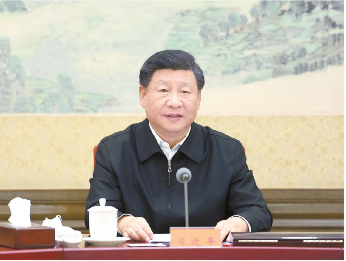
12 - ايدىڭ 26 - كۇنىدەن 27 - كۇنىدەن ەيىن، جۇڭگو كوممۇنىستىك پارتىيىسى ورتالىق كومىتەتى ساياسىي يۇروسى دەموكراتىيالىق تۇرمىس جىيىنى اشتى، جۇڭگو كوممۇنىستىك پارتىيىسى ورتالىق كومىتەتىنىڭ باس شۇجى شى جىنپىڭ جىيىندى باسقاردى ۇرى ماڭىزدى ۇسوز سويلەدى.

نىندەگى تۇسىنكى اناعۇرۇم تەرەڭدەپ، ەكنى قورعاۋدى ورنىداۋداي ىدەيالىق سانالىقلىقى، ساياسى سانالىقلىقى، ارەكەت سانالىقلىقى اناعۇرۇم كۇشەيتۋ كەرەك. ۇشند شى، شى جىنپىڭ جاڭا ۇداۋر جۇڭخۇا سوتسىيالىزم ىدەياسىنىڭ ۇزاق بولاشاقتىق جە-تەكشىلىك ۇمانى جونىدەگى تانىمى اناعۇرۇم تەرەڭدەپ، شىن مانىدە وي - سانانى قارۇلاندۇرۇ، امايلىقا جەتەكشىلىك ەتۇ، قىزمەتتەردى لىگەرەتۋ كەرەك. ۇرتىشى، جۇڭگو ۇلگىسىدەگى وسزاماندىرىۋدى جايپاي لىگەرەتۋدىڭ جۇڭخۇا ەرەكشەلىكى، ماندىك تالابى، كەلەلى پىرىنسىپى جانە سوتسىيالىستىك وسزاماندىرىۋ قۇرۇلىسى ستراتەگىيالىق ورنالاستىرۇ جونىدەگى تانىمى اناعۇرۇم تەرەڭدەپ، جايپالى دا ۇر مىندەت جانە حاۋىپ - قاتەر، سايسى الدىندا باتلىقپەن كۇرەس جاساپ، جاۋاپكەرلىك-لىك ارقالاپ، سىكەرلىك كورسەتپ، پارتيا ۇش مىندەت اتقارۇ، خالىق ۇش جى-ۋاپكەرلىكىنى ادا ەتۇ كەرەك. بەشىشى، باسشى كادىرلارنىڭ پارتىيىنى جايپاي قاتاڭ باسقارۇ جانىدا باعدارلاۋىش رولى جونىدەگى تانىمى اناعۇرۇم تەرەڭدەپ، ۇز - وزنە توڭگەردىس جۇرگىزۋدە قاتاڭ بولسى، ەرەجەگە، تارتىپكە سانالى تۇردە بويسۇنۇ جانىدا بۇكىل پارتىياعا ونەگە بولۇ كەرەك. اتىشى، ۇرى پارتىياعا عانا ۇتان قىيىن ماسەلەلەردى شەشەن سەرگەكتىك پەن تاباندىلىقتى ساقتاۋ جونىدەگى تانىمى اناعۇرۇم تەرەڭدەپ، پارتىيىنى جايپاي قاتاڭ باسقارۇ ساياسىي جاۋاپكەرلىككە كىن مۇقيات اتقارۇ كەرەك.