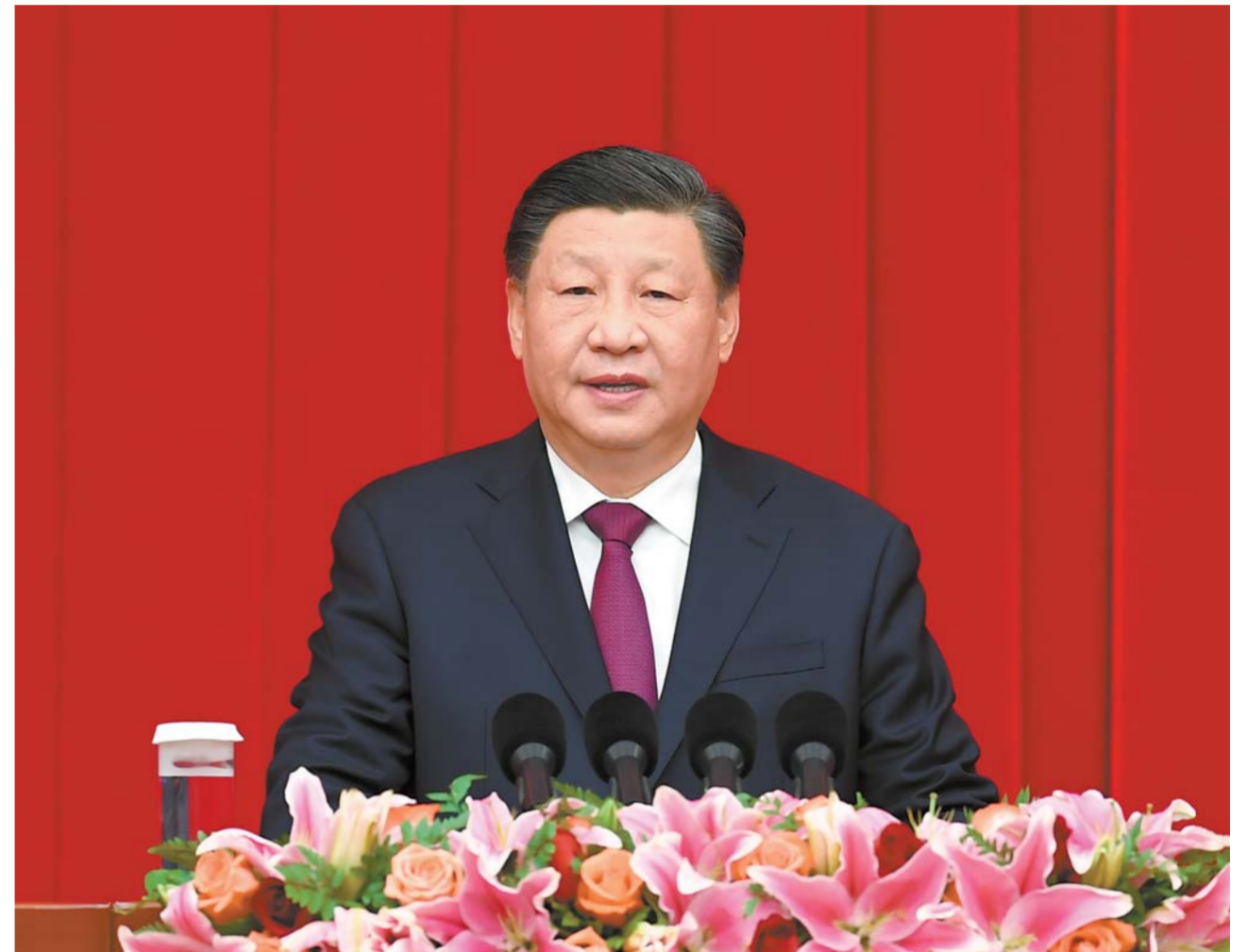
12 - ايدىڭ 30 - كۈنى مەملىكەتنىڭ ساياسىي كەڭەس بەيجىڭدە جاڭا جىل شاي ماڭىلىسىن وتكىزدى. جۇڭگو كوممۇنىستىك پارتىيىسى ورتالىق كومىتېتىنىڭ باس شۇجىسى، مەملىكەت تۇرغاسى، ورتالىق اسكەرىي سىتەر كومىتېتىنىڭ تۇرغاسى شى جىنپىڭ شاي ماڭىلىسىدە ماڭىزدى ءسوز سويلەدى.

لى كىچياڭ، لى جانىشۇ، لى چياڭ، جاۋ لىجي، ۋاڭ خۇنيڭ، ساي جى، دىڭ شۈەيشياڭ، لى شى، ۋاڭ چىشان قاتناستى، ۋاڭ ياك باسقاردى