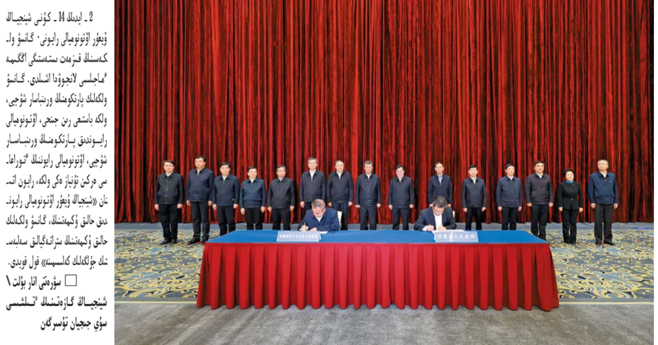
2 - ايدىڭ 14 - كۈنى شىنجاڭ ۋېرۋا ئۆتونومىيالى رايونى گانسۇ ۋەلگەسىدە قىزمەت سەستىگى اڭگىمە ھااجىلىسى لاجوۋدا لىدى. گانسۇ ۋەلگەلىك پارىكومنىڭ ورنىسازار ئۇچى، اۆتونومىيالى رايوننىڭ ئوراعا، سى ەركىن تۇنياز، ۋەلگە، رايون نى - نان (شىنجاڭ ۋېرۋا ئۆتونومىيالى رايون - دىق خالىق ۋەكىلەتلىك گانسۇ ۋەلگەلىك خالىق ۋەكىلەتلىك سەلبەسى - نىك جۇلگەلىك كەلسىمەنە) قول قويدى. □ سۈرەتنى انار بۇلت شىنجاڭ گازەتىنىڭ تىلىشى سۈي جىيان ئۆسۈرگەن

ساۋدا بازارىدا ادامدار قايشالسىتى، كەپىرەۋەر سەلبەستىك سىتەرىن اقلدا - سا، ەندى بىرەۋەر كۆرمە زىلنن تاۋار ساتىپ الپ جاتتى. شەكارا تۇرعىندارنىڭ ۇزارا بازارشاۋ ساۋدا بازارىنىڭ ج - ۋاپتىسى ۋاڭ ۋنچۇان تانىستىرىپ