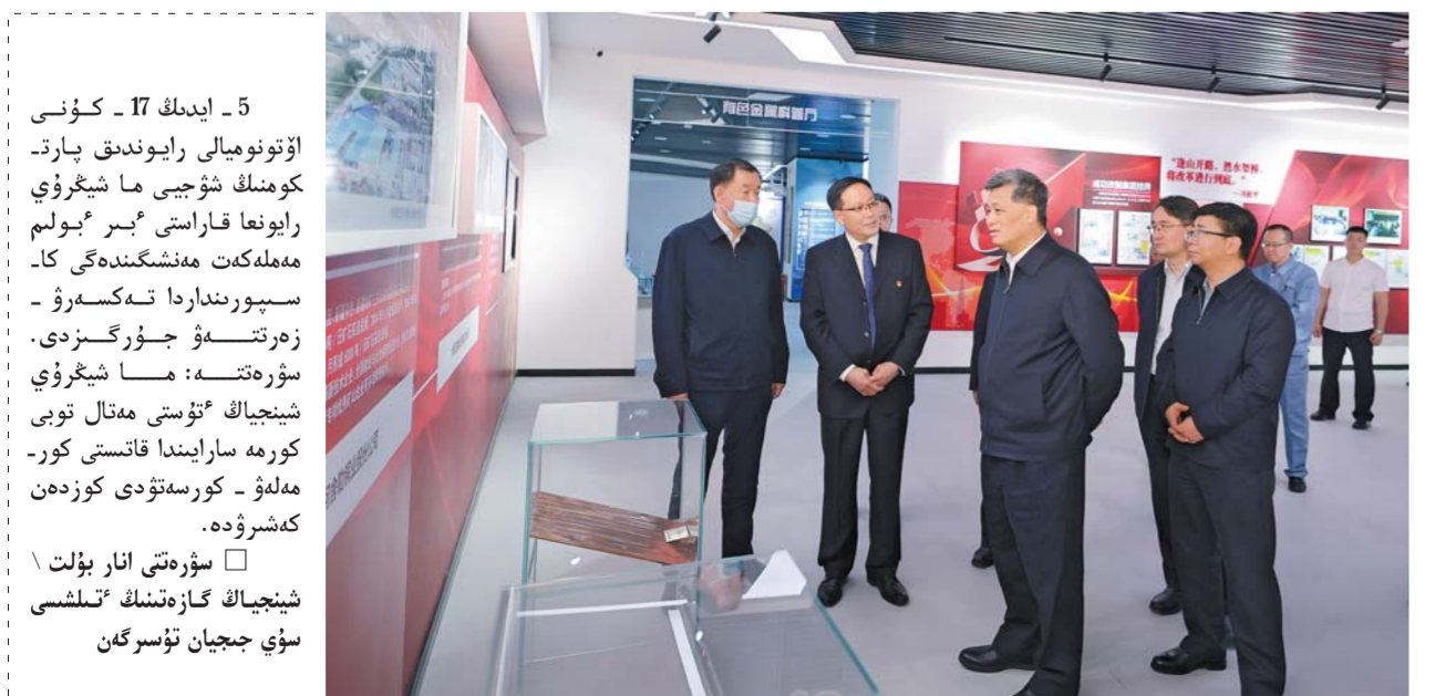
5 - ئاينىڭ 17 - كۈنى تۇستەن بۇرىن جۇڭگو كوممۇنىستىك پارتىيىسى ۋىتالىق كومىتەتنىڭ باش شۇجىسى، مەھەلەكت تۇراغاسى، ۋىتالىق اسكەرى سىتەر كومىتەتنىڭ تۇراغاسى شىخوۋا مۇراسىم باشقىلار مۇھىماتىنى ئىسپاتلايدۇ.

ما شىخوۋا رايونىغا قاراستى ئىبر بولىم مەھەلەكت مەنىشىگىندەگى كاسپورىندىدا نەكسەرۋ - زەرتتەۋ جۇرگىزىلەندە بىلاي دەپ باسا دارىپتەدى پارتىيا قۇرىلىسى ارقىلى جەتەكشىلىك ەتۋگە تاباندى بولسىپ، رەفورما جاساۋدى، جاڭلىق اشۋدى كۇشىلىتىپ، جۇڭگو ۋلگىسىدەگى وسزاماندىرىۋىدىك شىنجاڭ امالياتىن لىگەرلەتۋگە پارمەندى تەرەك ايزرلەۋ كەرەك