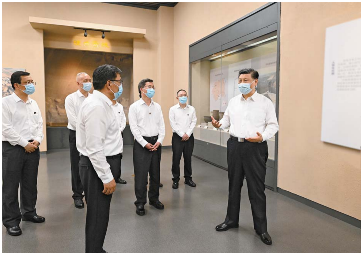
5 - ئاينىڭ 16 - كۈنى تۇستەن كەينى جۇڭگو كوممۇنىستىك پارتىيىسى ۋىتالىق كومىتەتنىڭ باش شۇجىسى، مەھەلەكت تۇراغاسى، ۋىتالىق اسكەرى سىتەر كومىتەتنىڭ تۇراغاسى شىخوۋا جۇڭگو - ۋىتالىق مۇراسىم باشقىلار مۇھىماتىنى ئىسپاتلايدۇ. شىخوۋا مۇراسىم باشقىلار مۇھىماتىنى ئىسپاتلايدۇ. شىخوۋا مۇراسىم باشقىلار مۇھىماتىنى ئىسپاتلايدۇ.

ساپار كەزىندە سانشىدىك يۇنچىڭنىدا قىزمەت تەكسەرەدى