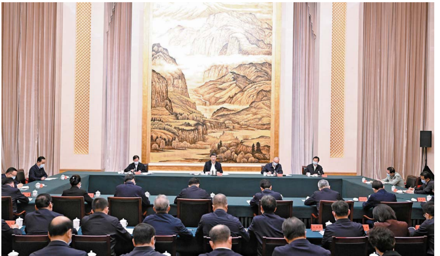
5 - ئاينىڭ 17 - كۈنى تۇستەن بۇرىن جۇڭگو كوممۇنىستىك پارتىيىسى ۋىتالىق كومىتەتنىڭ باش شۇجىسى، مەھەلەكت تۇراغاسى، ۋىتالىق اسكەرى سىتەر كومىتەتنىڭ تۇراغاسى شىخوۋا مۇراسىم باشقىلار مۇھىماتىنى ئىسپاتلايدۇ. شىخوۋا مۇراسىم باشقىلار مۇھىماتىنى ئىسپاتلايدۇ. شىخوۋا مۇراسىم باشقىلار مۇھىماتىنى ئىسپاتلايدۇ.

رەپ، جوعارى ساپالى دامۇ سىندى وسى ماڭداي الدى مىندەت. تى نەيز ارقاۋ ەتسىپ، بۇكىل ھەلدىكى دامۇ كەلەلى جاعداين كوزدە ۋىستاپ، شانشىدىك مۇس جۇزىندىك جاعداين تىياناق ەتسىپ، وزىندىك ايزالدىلقى ساۋلەلەندىرىپ، (جالعاسى 2 - بەتتە)