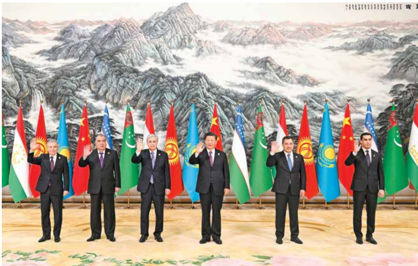
5 - ايدىك 19 - كۈنى تۇستەن بۇرىن مەملەكەت ەتوراعاسى شى جىنپىڭ شانىي ۋەكەسنىڭ شى - ان قالاسىدا تۇڭغۇش كەزدەتتى جۇڭگو - ورتا ازىيا باسشىلار ەماجلىسىنى باسقاردى ەرى «ۇزارا قارايلاساتىن، بىرگە دامىتىن، جالىي بەتتىك جاۋىپسىز، ۇرپاقتار بويى دوس بولاتىن جۇڭگو - ورتا ازىيا تاعدىرلاس ورتاق تۇلغاسىن قول ۇستاسا قۇرۇدى» تاقىرىبىدا ارقاۋ ەسوز سويلەدى. قازاقستان زۇڭتۇڭى توقايەۋ، قىرغىزستان زۇڭتۇڭى جاپاروۋ، تاجىكىستان زۇڭتۇڭى راجىمۇد، تۈركمەنىستان زۇڭتۇڭى بەردىمۇ -حامەدوۋ، ۋەزەكىستان زۇڭتۇڭى مىرزىيويەۋ قاتنىستى.

ۇزارا قارايلاساتىن، بىرگە دامىتىن، جالىي بەتتىك جاۋىپسىز، ۇرپاقتار بويى دوس بولاتىن جۇڭگو - ورتا ازىيا تاعدىرلاس ورتاق تۇلغاسىن قول ۇستاسا قۇرۇدى باسا دارىپتەدى