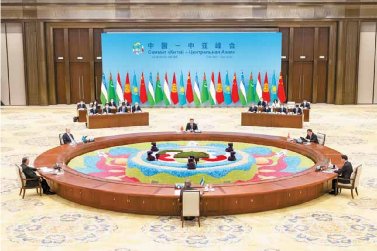
5 - ايدىك 19 - كۈنى تۇستەن بۇرىن مەملەكەت ەتوراعاسى شى جىنپىڭ شانىي ۋەكەسنىڭ شى - ان قالاسىدا تۇڭغۇش كەزدەتتى جۇڭگو - ورتا ازىيا باسشىلار ەماجلىسىنى باسقاردى ەرى «ۇزارا قارايلاساتىن، بىرگە دامىتىن، جالىي بەتتىك جاۋىپسىز، ۇرپاقتار بويى دوس بولاتىن جۇڭگو - ورتا ازىيا تاعدىرلاس ورتاق تۇلغاسىن قول ۇستاسا قۇرۇدى» تاقىرىبىدا ارقاۋ ەسوز سويلەدى. قازاقستان زۇڭتۇڭى توقايەۋ، قىرغىزستان زۇڭتۇڭى جاپاروۋ، تاجىكىستان زۇڭتۇڭى راجىمۇد، تۈركمەنىستان زۇڭتۇڭى بەردىمۇحامەدوۋ، ۋەزەكىستان زۇڭتۇڭى مىرزىيويەۋ قاتنىستى. □ سۇرەتتى شىنجاڭنىڭ تىلشەرمى شىن جۇڭ تۇسىرگەن

شىنجاڭنىڭ ەگەنتىگىنىڭ 5 - ايدىك كۈنى شى - انان بەرگەن جاپارى (تىلشە - لمەر جۇ جىياڭ، لىۋ جۇا، شۇي كى). 5 - ايدىك 19 - كۈنى تۇستەن بۇرىن مەملە - كەت ەتوراعاسى شى جىنپىڭ شانىي ۋەكە - سنىڭ شى - ان قالاسىدا تۇڭغۇش كەزدە - تى جۇڭگو - ورتا ازىيا باسشىلار ەماجلى - سىنى باسقاردى. قازاقستان زۇڭتۇڭى توقا - يەۋ، قىرغىزستان زۇڭتۇڭى جاپاروۋ، تا - جىكىستان زۇڭتۇڭى راجىمۇد، تۈركمەنىستان زۇڭتۇڭى بەردىمۇحامەدوۋ، ۋەزەكىستان زۇڭتۇڭى مىرزىيويەۋ قاتنىستى. مەملەكەت باسشىلارى جۇڭگونىڭ ورتا ازىيادى 5 ەلەن دوستىق بارىس - كەلس تارىخىنا دوستىق بەنەمەن جاپىي قايىرلا قاراپ، ەر سالادى سەلبەستىك تاجىرىيەلەرن قورد - تىندىلاپ، بولاشاقتى سەلبەستىك بەتالىستى كوز جىبەردى، بولاشاقتى كوزدە ۇستاپ، ان - عۇرلىم تەمز جۇڭگو - ورتا ازىيا تاعدىرلاس ورتاق تۇلغاسىن قول ۇستاسا قۇرۇعا ەبىر اۋىزدان قوسىلدى. 5 - ايدىعى شى - اندا ۇان ەتۇرلى گۇلدەر جاپىقلا اشىلىپ، بار تىرشىلىك ۋەمىر شەڭدىك كۇشكە تولدى. بايى ۋەنە - نىڭ بويىندى شى - ان حالقارالىق ەماج -