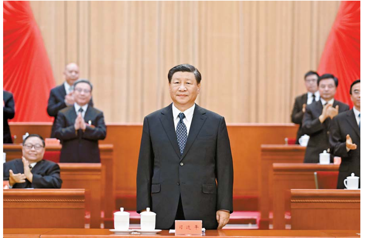
9 - ايدىڭ 18 - كۈنى جۇڭگو مۇگەدەكتەر بىر لەستىگىنىڭ مەملەكەتتىك 8 - قۇرلىتايى بەيجىڭ خالىق سارايندا اشلىدى. سۇرەتتە: جۇڭگو كوممۇنىستىك پارتىيىسى ورتالىق كومىتەتنىڭ باس شۇجى، مەملەكەت ئوراعاسى، ورتالىق اسكەرى سىتەر كومىتەتنىڭ ئوراعاسى شى جىنپىڭ ئوراعالار مەنبەسىدە قۇرلىتايغا قاتنىشقان ۋاكىلەردىگە قۇرەمەن بىلدۈرۈدە.

سوتسىيالىزم يەدەياسىن جەتەكشى ەتسپ، پارتيا 20 - قۇرلىتايىنىڭ رۇخىن جايپاي دابەكتەندەندى رىپ، قالىڭ مۇگەدەكتەردى جۇڭگو ۋلگىسىدەگى وسزماماندندىرۇ بارىسندا ئاناعۇرۇم باقتى، تاماشا تۇرمىس جاراتۇغا ئىنتىپاقىستىرىپ جانە باسقا تىپكەن ۋلگەن كەرمە تۇلىنىڭ. بۇكىل ەلدىڭ جەر - جەرنەن كەلگەن 600دەن استام ۋاكىل 85 مىللىون مۇگەدەكتىڭ ماڭىزدى تاپسىرماسىن ارقالاپ قۇرلىتايغا قاتنىستى.