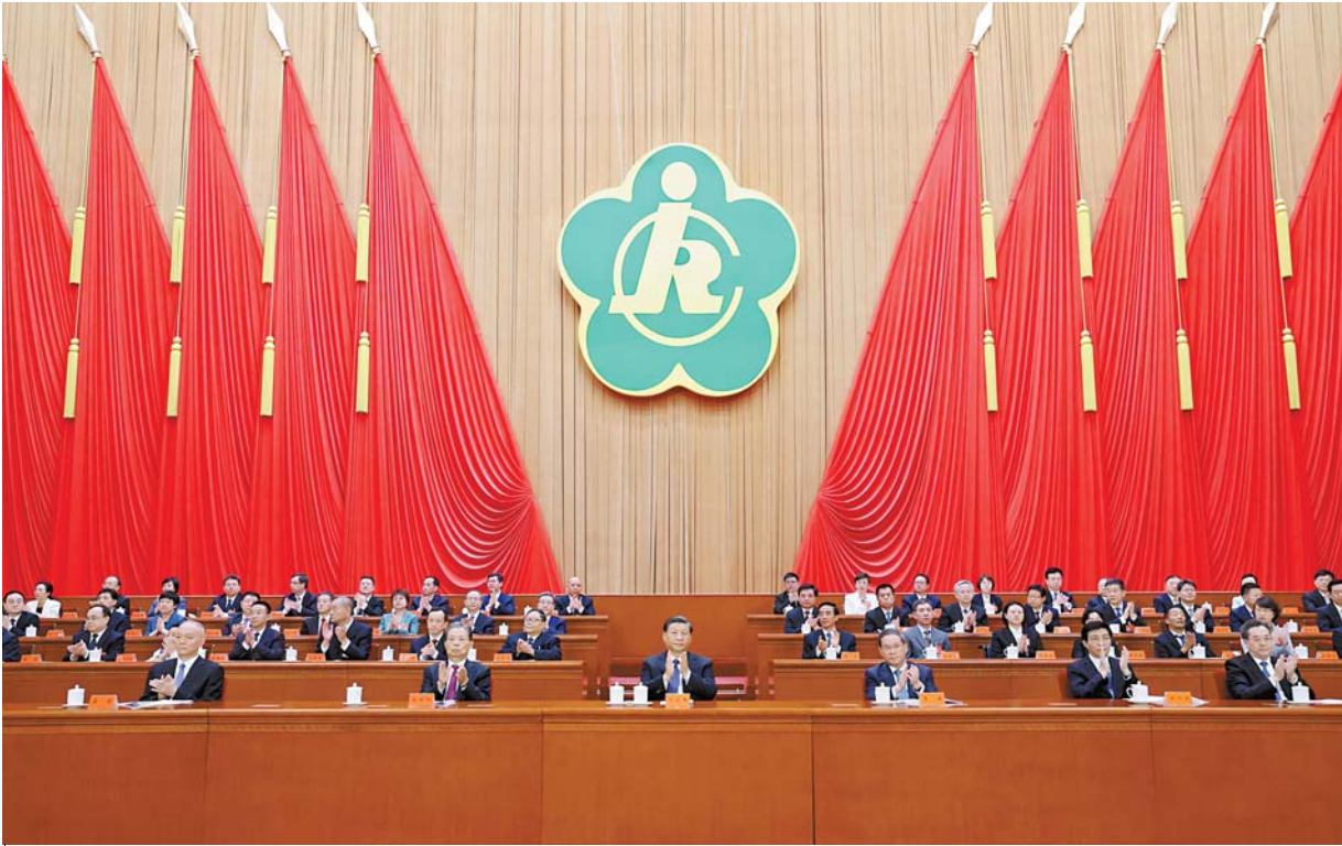
9 - ايدىڭ 18 - كۈنى جۇڭگو مۇگەدەكتەر بىر لەستىگىنىڭ مەملەكەتتىك 8 - قۇرلىتايى بەيجىڭ خالىق سارايندا اشلىدى. شى جىنپىڭ، لى چياڭ، جاۋ لىجى، ۋاڭ خۇنىڭ، ساي چى، دىڭ شۇەشىياڭ قاتارلىقلار ئوراعالار مەنبەسىنەن ورنىمى، قۇرلىتايىدىڭ اشلىغاندىن قۇتتىقتادى. □ سۇرەتنى شىنجاڭ ئاگىنتىسىنىڭ ئىشلىشى پاك شىغىلى تۇسرىگەن

شى جىنپىڭ، لى چياڭ، جاۋ لىجى، ۋاڭ خۇنىڭ، ساي چى قۇرلىتايغا بارپ قۇتتىقتادى، دىڭ شۇەشىياڭ پارتيا ورتالىق كومىتەتى، مەملەكەتتىك كەڭەس اتىنان ارناۋ سوز سويلەدى